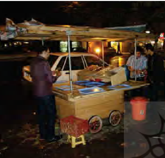
شکل ۷- بساط کباب فروشی در خیابان امام خمینی در شب (از عناصر عملکردی هویت بخش رشت)

یکی از پتانسیل های بالایی که شهر رشت دارا می باشد و آن را از سایر شهرهای کشور متمایز می نماید و می تواند هویت ویژه ای به این شهر ببخشد، ادامه داشتن انواع فعالیت ها به خصوص فروش مواد غذایی تا پاسی از شب می باشد که حال و هوای خاصی به شهر می دهد. رفت و آمد و جنب و جوش تا نیمه های شب در خیابان های این شهر ادامه دارد و کمتر خیابان های آن به حالت سکون درمی آیند. این مسأله می تواند یکی از نقاط قوت برای هر شهری باشد و می توان ایده شهر در شب را برای شهر رشت مطرح و بدین ترتیب جهت ارتقای هویت آن اقدام نمود.