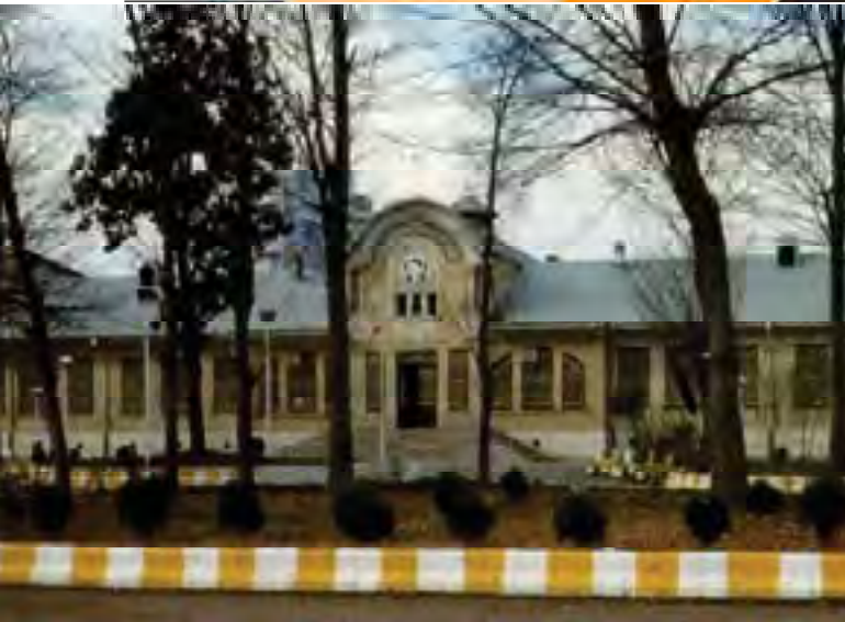
شکل ۲- دبیرستان شهید دکتر بهشتی (یکی از عناصر تاریخی هویت رشت)

منابع آب های سطحی این شهر دو رودخانه زرجوب و گوهررود در شرق و غرب می باشند و از عناصر طبیعی این شهر می توان به باغ محتشم اشاره نمود که از تفرجگاه های قدیمی، زیبا و دیدنی رشت می باشد و در کنار محله های قدیمی رشت و رودخانه گوهررود قرار گرفته است. درختان تنومند و پیر نارون و آزاد به باغ محتشم جلوه ویژه ای بخشیده و آن را به گردشگاهی کم نظیر و باصفا تبدیل کرده است. در واقع باغ محتشم یک مؤلفه طبیعی هویت رشت محسوب می گردد.