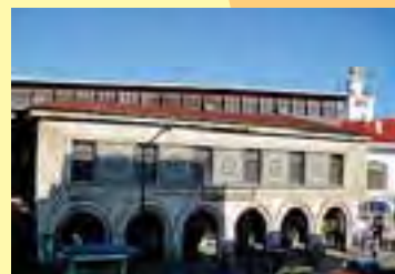
شکل ۴- کتابخانه ملی رشت (عنصر کالبدی هویت رشت)

توده ها، محلات، حوزه ها و فضاهای شاخص شهری: از محلات قدیمی رشت که در تشکیل آنها عواملی چون: اعتقادی، اقتصادی و ... دخیل بودند، می توان به محلات کیاب، خمیران زاهدان، چمارسرا، استادسرا، بازار، صیقلان، خواهر امام، سرخبنده، آفخرا، چله خانه و ... اشاره کرد. از مهم ترین فضاهای شاخص شهری رشت می توان بازار بزرگ و اصلی شهر رشت را نام برد که همواره علاوه بر ساکنین رشت، اهالی سایر شهرهای استان گیلان را نیز به خود جذب می نماید. این بازار با وسعتی معادل ۳۳۰۰۰۰ مترمربع، در ضلع جنوب شرقی میدان مرکزی (شهرداری) شهر قرار داشته و مجموعه ای واحد و مستقل از راسته ها، دکان ها، میادین، تیمچه ها، کاروانسراها و مکان های عمومی را تشکیل می دهد. از دیگر فضاهای شاخص شهری رشت می توان به بازار رضا، بازار روز (واقع در سعدی)، بازارچه خواهر امام (محل فروش لوازم دسته دوم در محله خواهر امام) و ... اشاره کرد.