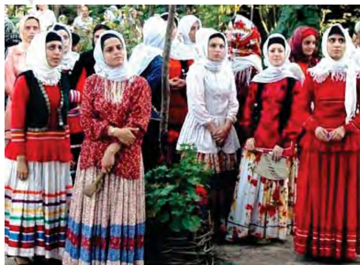
شکل ۸- لباس محلی بانوان رشتی (از عناصر مؤلفه انسانی هویت رشت)

مراسم چهارشنبه سوری، شب چله (شب یلدا)، کشتی گیله مردی، لافند بازی (نمایش بند بازی) و انواع بازی ها مانند آپاربازی، آغوز بازی و ... از جمله آداب و رسوم این خطه محسوب می گردند.