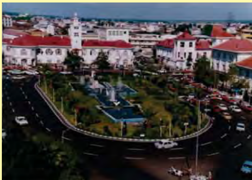
شکل ۳- مجموعه شهرداری رشت (مهم ترین شاخصه هویت بخش رشت)

از پارک های مهم این شهر می توان به پارک شهر (باغ محتشم)، پارک سبزه میدان، بوستان ملت، بوستان کشاورز، پارک دانشجو، پارک توحید و ... اشاره نمود.