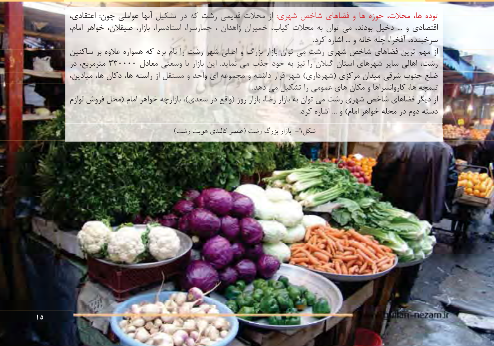
شکل ۶- بازار بزرگ رشت (عنصر کالبدی هویت رشت)

توده ها، محلات، حوزه ها و فضاهای شاخص شهری: از محلات قدیمی رشت که در تشکیل آنها عواملی چون: اعتقادی، اقتصادی و ... دخیل بودند، می توان به محلات کیاب، خمیران زاهدان، چمارسرا، استادسرا، بازار، صیقلان، خواهر امام، سرخبنده، آفخرا، چله خانه و ... اشاره کرد. از مهم ترین فضاهای شاخص شهری رشت می توان بازار بزرگ و اصلی شهر رشت را نام برد که همواره علاوه بر ساکنین رشت، اهالی سایر شهرهای استان گیلان را نیز به خود جذب می نماید. این بازار با وسعتی معادل ۳۳۰۰۰۰ مترمربع، در ضلع جنوب شرقی میدان مرکزی (شهرداری) شهر قرار داشته و مجموعه ای واحد و مستقل از راسته ها، دکان ها، میادین، تیمچه ها، کاروانسراها و مکان های عمومی را تشکیل می دهد. از دیگر فضاهای شاخص شهری رشت می توان به بازار رضا، بازار روز (واقع در سعدی)، بازارچه خواهر امام (محل فروش لوازم دسته دوم در محله خواهر امام) و ... اشاره کرد.