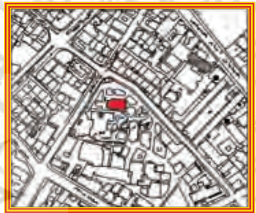
- موقعیت ساختمان ثبتی بیمارستان پورسینا در نقشه وضع موجود شهر رشت

استان گیلان، شهرستان رشت، بخش مرکزی، چهار راه میکائیل - چهارراه پورسینا