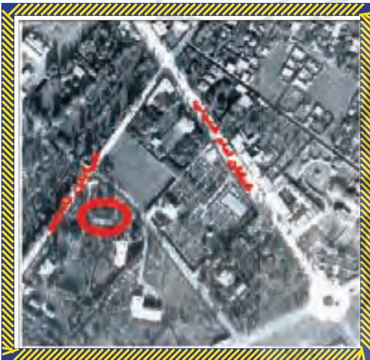
- موقعیت ساختمان ثبتی بیمارستان پورسینا بر روی عکس هوایی سال ۱۳۳۵ ه.ش