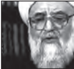
آیت الله محی‌الدین انواری