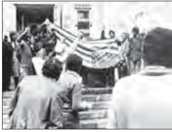
تسخیر لانه جاسوسی توسط دانشجویان انقلابی