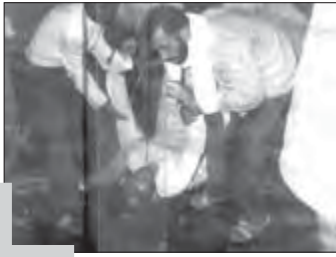
حج خونین، مرداد ۱۳۶۶