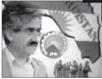
مصطفی هجری دبیر کل حزب دمکرات کردستان

و به ورشکستگی و کناره گیری جناح لیبرالی انجامید که توانسته بود اهرم های دستگاه دولتی نظام نوپای برخاسته از انقلاب را به دست گیرد. این جناح علی رغم آرمان ها و خواسته های رهبری انقلاب و امت انقلابی، سازش با غرب را، در حد تسلیم بی قید و شرط به آمریکا و تمکین در برابر خواسته های سیاسی، اجتماعی و اقتصادی نظام پوسیده و فاسد گذشته در پیش گرفته بود. در مرداد ۱۳۶۶ یکی از خونین ترین توطئه ها علیه نظام جمهوری اسلامی به اجرا درآمد؛ فاجعه مکه، در این رخداد، راهپیمایی برائت از مشرکین حجاج بیت الله الحرام به خاک و خون کشیده شد و ۴۰۰ زائر خانه خدا که بسیاری از آن ها زنان بودند، به شهادت رسیدند. پس از فاجعه مکه، استراتژی