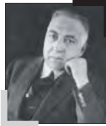
میرزا حسن خان وثوق الدوله عاهد قرارداد ۱۹۱۹ با انگلیسی ها