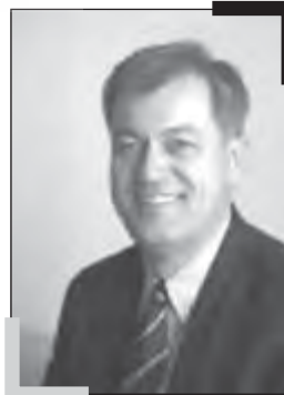
ریچارد کاتم یکی از مأموران قدیمی سیا در ایران

جملات فوق شاید یکی از کامل‌ترین جملاتی است که می‌توان در مورد انگلیسی‌های مغرور و متکبر و در عین حال فرصت‌طلب در لابلای کتاب‌های تاریخی و گفته‌های تاریخی یافت. واقعیت آن است که در تاریخ حیات سیاسی انگلستان، هر جا واژه‌هایی نظیر فتنه‌گری، توطئه، فرصت‌طلبی، نفاق، حسادت و خودخواهی در عالم سیاست وجود داشته باشد، ناخودآگاه اذهان همگان به سمت دولت انگلستان معطوف می‌شود. در ایران نیز به علت سابقه بسیار بد دولت بریتانیا در عرصه سیاسی و اقتصادی کشور، همواره اذهان ایرانیان نسبت به انگلیسی‌ها همراه با بدبینی و سوءظن و تنفر بوده است. «ریچارد کاتم» نویسنده سرشناس آمریکایی، ضمن اشاره به نفرت ایرانیان از انگلیسی‌ها می‌نویسد: «این نفرت و انزجار، با نوعی ترس و حتی حس تکریم و احترام به هم آمیخته و می‌توان گفت که در هیچ جای دنیا، این قدر درباره هوشیاری و توانایی انگلیسی‌ها مبالغه نشده و در هیچ کشوری یک ملت به دلیل هوشیاری و کیاست خود، این