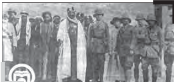
شیخ خزعل در کنار عبدالعزیز بن سعود و شیخ جابر الصباح (امیر کویت) و تنی چند از عوامل انگلیسی همچون سرپرسی کاکس (۱۹۱۶-کویت)

انگلیسی‌ها همچنین در اندیشه تجزیه خوزستان از ایران بودند. این توطئه توسط مهره سرسپرده‌ای به نام «شیخ خزعل» به مرحله اجرا درآمد. در اوایل رئیس‌الوزرای رضاشاه، شیخ خزعل به تشکیل اتحادیه عشایر جنوب مبادرت ورزید که عشایر عرب را با بختیاری‌ها متحد می‌ساخت و خود شیخ خزعل آن را رهبری می‌کرد. این اتحادیه در ماه آوریل ۱۹۲۲ با کمک و شرکت «پیل» که کنسول انگلیس در اهواز بود و بر اثر تحریک انگلیسی‌ها که سعی داشتند حکومت مرکزی تهران را تحت فشار قرار دهند، در خوزستان تشکیل گردید. این اتحادیه به تبلیغات تهدیدآمیز تشکیل «عربستان آزاد» در جنوب ایران دست می‌زد. انگلیسی‌ها در صدد آن بودند که به کمک این اتحادیه، نواحی جنوب ایران را که نواحی نفت‌خیزی بود، به تسلط کامل خود درآورند، ۳۷ اما این توطئه نیز ناکام ماند و استعمار پیر به این هدف نامقدس خود نرسید.