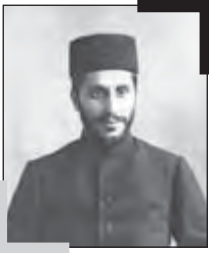
سیاضیاءالدین طباطبائی همدست رضاخان در کودتای ۱۲۹۹

بدین طریق، پایه‌های استبداد رضاخانی با کمک جدی انگلیسی‌ها پی‌ریزی شد و با چراغ سبز و تلاش جدی دولت بریتانیا بر عرصه جغرافیای سیاسی ایران زمین، بیش از نیم قرن حاکمیت پهلوی‌ها رقم خورد.