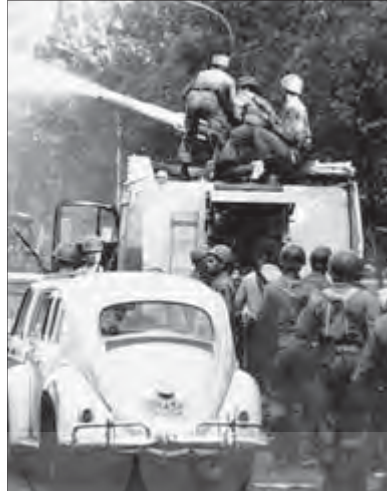
▼ تظاهرات انقلاب اسلامی