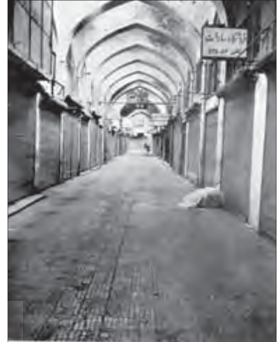
▼ اعتصاب بازار در اعتراض به رژیم شاهنشاهی