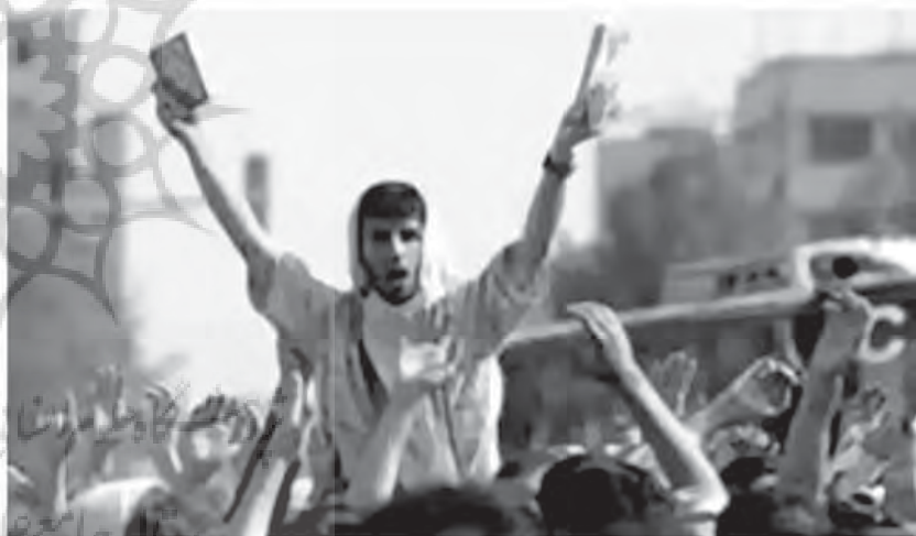
تظاهرات مسلمانان در اعتراض به چاپ تصاویر مؤمنان به پیامبر اسلام (ص)

احترام گذاشته شده و علی‌رغم این که در اصل ۱۲، دین رسمی کشور اسلام و مذهب شیعه اثنی‌عشری معرفی شده اما در اصل ۱۳ به پیروان سایر ادیان اشاره کرده و بیان می‌دارد آنها در انجام مراسم دینی خود آزاد هستند و در احوال شخصیه مثل نکاح و طلاق و ... تابع دین خویش می‌باشند.