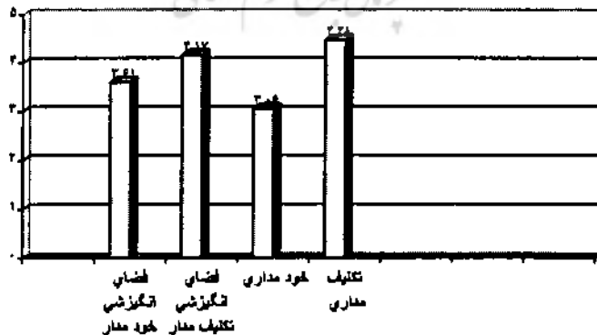
نمودار ۲ - مقایسه میانگین های جهت گیری هدفی و فضای ادراک شده انگیزشی ادراک شده