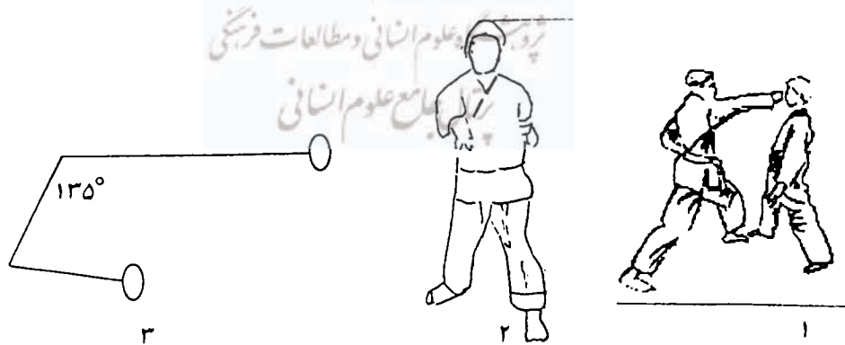
شکل ۱-۱ نمایش مشت معکوس از پهلو ۱- از روبه رو، ۲- دیاگرام آزاد اندام فوقانی (بازو و ساعد) قبل از اجرا و بعد از اجرا از نمای پهلو، ۳- آرنج از فلکشن ۹۰ تا صفر درجه و شانه از اکستنشن ۴۵ تا فلکشن ۹۰ درجه

سرعت بالای بازوی ضربه با پرتاب می پذیرد. عمل پرتاب کردن فرایند درگیری اندام بدن برای شتابدهی به شیشی یا اندام مورد نظر است (۵) که البته نسبت به هدف مورد نظر در مهارت‌ها تفاوت در اجرای حرکتی دیده می شود. این تفاوت‌ها شامل پرتاب بازو از قسمت بالایی شانه (مانند پرتاب ییسال و نیزه)، پرتاب بازو از قسمت پایینی شانه (مانند پرتاب سافت بال)، پرتابی که در آن مانع پرتابی با حرکتی فشاری پرتاب می شود (مانند پرتاب وزنه)، پرتابی که مانع پرتابی با کشیدن پرتاب می گردد (مانند پرتاب چکش و دیسک) و... می شوند (۱۰). در این میان با توجه به حرکت بازو در مشت معکوس می توان در قسمت پرتاب بازو از قسمت پایینی شانه قرار داد. از سوی دیگر می توان به تشابه حرکت پرونیشن ساعد با پرونیشن پرتاب نیزه اشاره کرد که همانند پرتاب نیزه ساعد از وضعیت سوپینشن در ابتدای حرکت به حالت پرونیشن در می آید که قسمت اعظم این چرخش نیز باید در انتهای حرکت صورت گیرد (۱۰). سینماتیک پرتاب‌ها سه بعدی است، ولی در این تحقیق با توجه به ویژگی مشت معکوس که قسمت عمده آن در دو بعد است و به ویژه اینکه بازو و دست مسافت کمتری را نسبت به پرتاب هایی چون نیزه یا ییسال می پیماید، از این رو سینماتیک ضربه به صورت دوبعدی در نظر گرفته شده است (۱۰). توالی ضربه مشت معکوس در شکل ۱ نشان داده شده است.