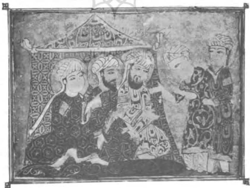
زائران مکه در خیمه، مقامات حریری؛ مقام چهارم. کتابت ۵۷۳۸ ه.ق.