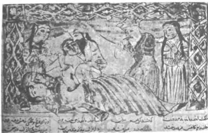
تولد رستم. شاهنامه فردوسی؛ کتابت. اوائل سده هشتم ه.ق.