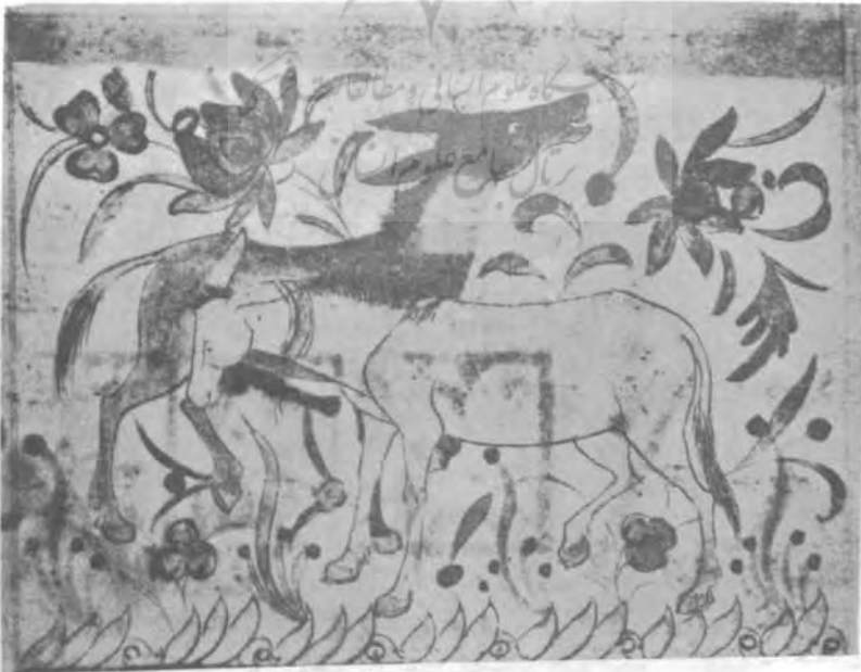
دوخر، منافع الحيوان ابن يختيشوع؛ کتابت. اوائل سده هجری هفتم ۵ ق.