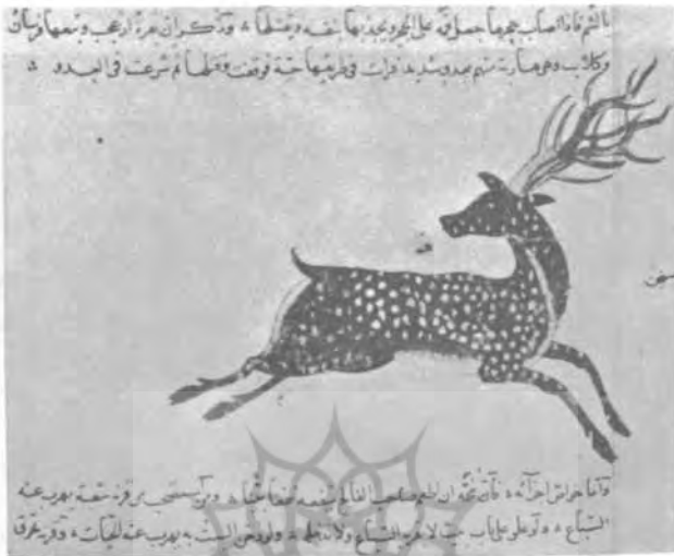
گوزن، عجایب المخلوقات قزوینی؛ کتابت. سده هجری هشتم ۵ ق.