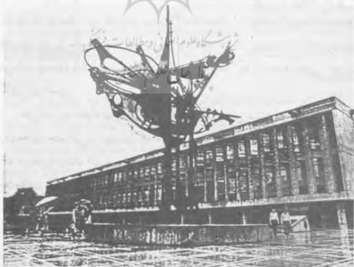
کتابخانه دولت جمهوری ترکمنستان