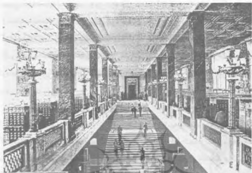
ورودی اصلی کتابخانه دولتی لنین در اتحاد جماهیر شوروی