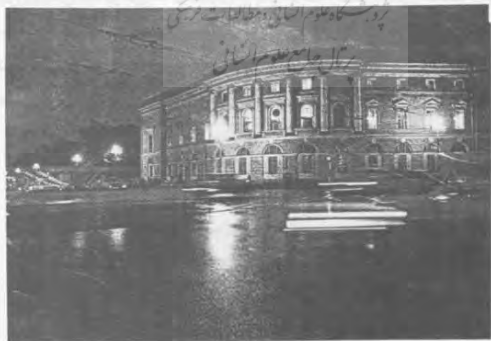
کتابخانه سالنیکوف - شچدرین