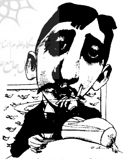
کاریکاتور پروست، کاری از دیوید لوین.

استطراد نامرئی را معلوم می دارد تا خواننده با شناخت آنها، اثر را بهتر فهم کند. پس پروست این ظرافت را دارد که به هر کس مجال می دهد تا شیوه قرائت و دریافت خاص خویش را برگزیند، یعنی خود اراده کند که چه چیزی برای وی مهم است و چه چیزی ثانوی است و بنابراین، روان شناس بزرگی است. بدین گونه رمان به تعداد خوانندگان با ذهنیت های گوناگون، تکثیر می شود و می شکند، زیرا پروست ایمان دارد که حقیقت درباره آدم ها چیزی مطمئن و قطعی و به تمام و کمال دست یافتنی نیست. از این رو میان استطرادهای پروست و تعدد و تکثر اذهان رابطه ای هست، برخلاف سبک نگارش فروید که می پنداشت به حقیقت وجود پی برده است. نوشته فروید شفاف است، اما