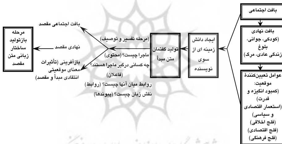
شکل ۱ انگاره تطبیقی تبیین در فرآیند برابریابی برگرفته از انگاره تبیین فرکلاف

فرضیه‌های تحقیق قصد داریم با شیوه تفسیری متن، افقی تازه و نیز راهکاری متفاوت را برای فرآیند برابریابی در امر ترجمه معرفی کنیم. طبق انگاره ۱ در فرآیند برابریابی در متن مقصد که از الگوی تبیین فرکلاف الهام گرفته است، ابتدا پیش از تحلیل برابریابی انتخاب شده از سوی مترجم در داستان «خوهران» تفسیر و تبیینی از این داستان کوتاه ارائه می‌دهیم، سپس به بازنمایی برابریابی و توصیف آن‌ها براساس الگوی فرکلاف می‌پردازیم. به دلیل حجیم شدن مقاله، از تشریح مستقیم عناصری از قبیل بافت موقعیتی، نوع گفتمان، دانش زمینه‌ای، بافت بینامتنی، ظاهر کلام، معنای کلام، انسجام موضعی، ساختار متن و جان‌مایه که همگی از عناصر تفسیر هستند، پرهیز می‌کنیم و تنها در تحلیل داده‌ها به آن‌ها می‌پردازیم.