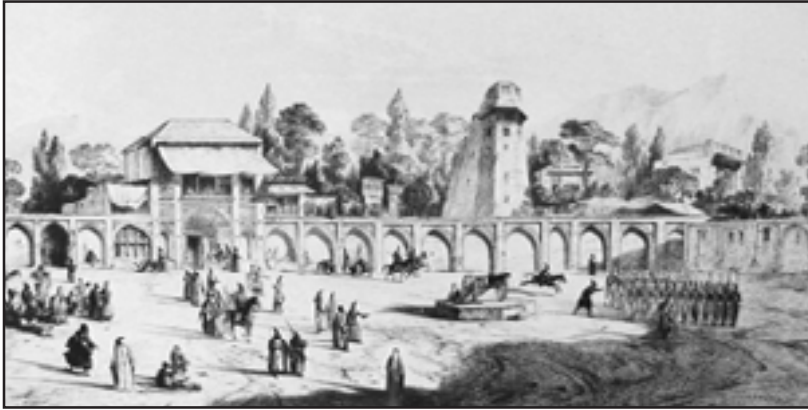
میدان ارگ و سردر تخت مرمرو برج آقا محمدخانی / توپ مروارید (۵۷-۱۲۵۶ ه. ق)

و تقسیم آب، باروت خانه، قورخانه، امام زاده سیدناصرالدین (سیدناصرالدین)، گذر درخونگاه، گذر سیدناصرالدین و مسجد حاج رجبعلی.