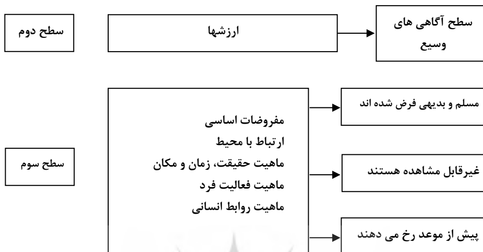
نمودار ۱: سطوح فرهنگ (مقیم، ۱۳۷۷، ص ۱۷۱)

هنگامی که انسان وارد سازمانی می‌شود «دست‌ساخته‌های انسانی» آن را مشاهده و احساس می‌کند. این دست‌ساخته‌های انسانی همه چیز را از جانمایی کالبدی، دستور پوشاک، شیوه مخاطب ساختن یکدیگر، بو و احساس محل، شدت احساسهای عاطفی و دیگر پدیده‌ها گرفته تا تجلیات بادوام پایدارتری چون قانون اساسی، مدارک و اسناد، بیانیه‌ها و قراردادهای و قوانین موضوعه سالانه و آیین‌نامه‌های حاکم بر سازمانها در بر می‌گیرد.