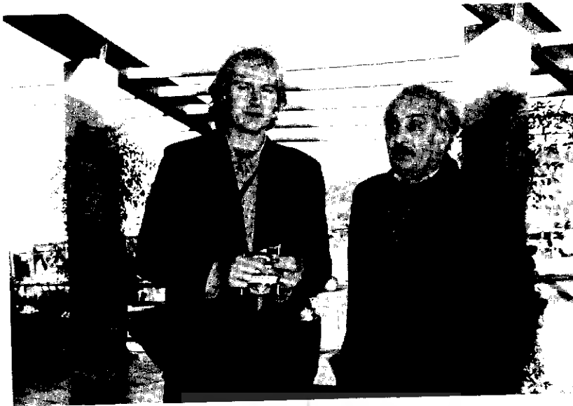
با شاعر انگلیسی مک کندریک