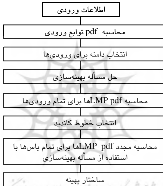
شکل ۱- ساختار روش پیشنهادی

- باسهای چاه ۴ : به عنوان مجموعه‌ای از باس‌ها که دارای بیشترین مقدار میانگین LMP (MLMP) و کمترین مقدار انحراف از معیار LMP (VLMP) می‌باشند، انتخاب می‌شوند. - خطوط کاندید مجموعه‌ای از خطوط هستند که میان هر باس چشمه و هر باس چاه ایجاد می‌شوند. مرحله ششم: با تکرار مراحل (۱ تا ۴) و با معرفی یک خط کاندید در هر مرحله VLMP, MLMP, MP, تمام باس‌های چاه محاسبه می‌شود. مرحله هفتم: بهترین طرح برای کاهش LMP هر باس چاه با توجه به کمترین مقدار MLMP و VLMP یافته می‌شود. شکل شماره (۱) ساختار روش معرفی شده را نشان می‌دهد.