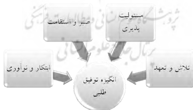
نمودار شماره ۲. ویژگی‌های رفتاری مؤثر بر توفیق‌طلبی

همان‌طور که در نمودار شماره ۲ دیده می‌شود، چهار ویژگی تلاش و تعهد، مسئولیت‌پذیری، صبر و استقامت و ابتکار و نوآوری در رفتار یک فرد توفیق‌طلب به‌طور بارز و برجسته وجود دارد (اعتصامی، ۱۳۸۸).