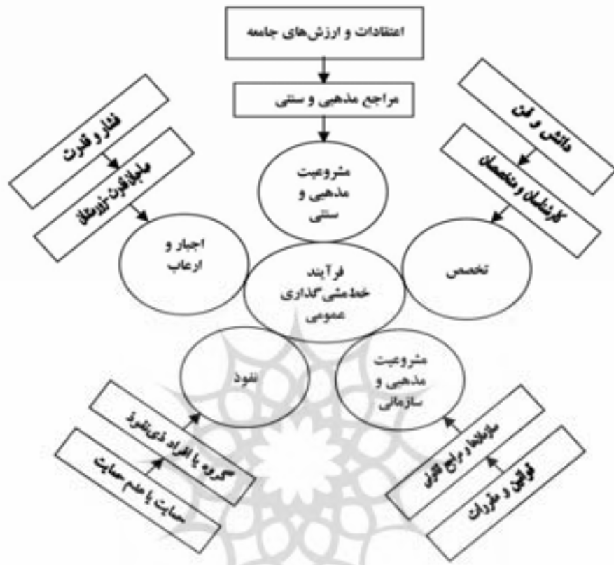
شکل ۳. مدل چندبعدی خط‌مشی‌گذاری عمومی (الوانی، ۱۳۷۹، ص ۱۵۶)

۳. کارکرد مدل مبنا: حوزه‌های مداخله دیپلماسی عمومی بر تصمیم‌سازی با توجه به هدف این نوشتار و بر مبنای مدل ارائه‌شده برای بررسی، در ادامه به حوزه‌ها و زمینه‌هایی اشاره می‌شود که امکان مداخله در فرآیند سیاست‌گذاری و تصمیم‌گیری و یا به عبارت دیگر، تأثیرگذاری بر تصمیم‌سازی را فراهم می‌آورند. نگاهی به پیش‌زمینه‌های این مداخلات، ضروری به نظر می‌رسد: