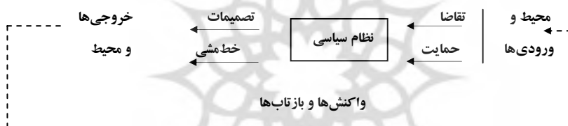
شکل ۵- تأثیر متقابل خط‌مشی عمومی و نظام سیاسی (تسلیمی، ۱۳۷۸، ص ۱۶۹)

در یک نظام سیاسی، ورودی‌ها، تقاضاها و حمایت‌ها هستند و خروجی‌ها عبارت‌اند از تصمیم‌ها و خط‌مشی‌ها. سیاست‌گذاری عمومی در یک جامعه از عواملی نظیر نظام سیاسی متأثر است و در عین حال، بر شکل‌یابی تقاضاها و به همراه آن بر حمایت‌ها و پشتیبانی‌هایی که نظام سیاسی را به وجود می‌آورد، تأثیر محیطی دارد. به بیان دیگر، تقاضاها و حمایت‌های شناخته‌شده به موجب خط‌مشی‌ها شکل می‌گیرند؛ از این رو، در سیاست‌گذاری و تصمیم‌گیری باید تقاضاها و حمایت‌های اجتماعی و عمومی، پیشاپیش مطالعه و سنجش شوند و پیش‌بینی‌های لازم در نظر گرفته شود. شکل زیر تأثیر متقابل سیاست‌گذاری عمومی و نظام سیاسی را نشان می‌دهد (خوشوقت، ۱۳۷۵، ص ۱۴۶).