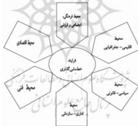
شکل ۲. محیط‌های مؤثر بر فرآیند خط‌مشی‌گذاری (الوانی، ۱۳۷۹، ص ۱۵۲)

همه فرآیندهای مختلف خط‌مشی‌گذاری ادعای کلیت دارند، اما تجربیات علمی و مطالعات علمی نشان داده است که فرآیندهای ثابت و الگوهای با ساختار انعطاف‌ناپذیر، نمی‌توانند در شرایط و موقعیت‌های در حال تغییر و تحول، همساز و هماهنگی لازم را دارا باشند. از این رو، صاحب‌نظران سیاست‌گذاری معتقدند الگوی اقتضایی که برگرفته از نگرش سیستمی ۶ است در هر جامعه و فرهنگ و در هر شرایط و موقعیتی کارساز است؛ زیرا در فرآیند تصمیم‌گیری، شرایط و محیط‌های مختلف تأثیرگذار بر فرآیند خط‌مشی‌گذاری را مدنظر قرار می‌دهد و سعی در حداکثرسازگاری با آن‌ها را دارد. این محیط‌ها عبارت‌اند از محیط فرهنگی-اجتماعی-ارزشی، محیط اقتصادی، محیط فنی، محیط اداری-سازمانی، محیط سیاسی-قانونی، و محیط اقلیمی-جغرافیایی (الوانی، ۱۳۷۹، ص ۱۵۱).