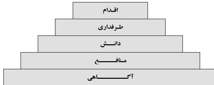
هرم ارتباطات دیپلماسی عمومی (McClellan, 2004)

توجه به این نکته ضروری است که هرچه به سوی پایین هرم برویم، میزان مخاطبان بیشتر می‌شود؛ در حالی که هرچه به سمت بالای هرم برویم، هزینه برقراری ارتباط با افراد مخاطب، نسبت به پایین هرم به طور فزاینده‌ای سنگین‌تر می‌شود. از این رو، کمترین سرانه هزینه، مربوط به پایین هرم و بیشترین آن، مربوط به نوک هرم است. به طور کلی، هر طبقه در این هرم، طبقه زیرین خود را می‌سازد و طبقه بالایی خود را حمایت می‌کند؛ برای مثال، یک فرد در ابتدا باید آگاهی کافی از زمینه‌های موردنیاز خود به دست آورد، آن گاه منافع را برای خود کسب کند، سپس نسبت به کشور حامی، دانش و شناخت لازم بیابد تا اینکه به یک حامی تبدیل شود و سرانجام، به اقدامی خاص در پشتیبانی از کشور حامی دست بزند. از جمله این اقدامات می‌توان به دادن رأی مثبت در سازمان‌های بین‌المللی، امضای توافقنامه‌های تجاری و قراردادهای دوطرفه، تصویب قوانین مطلوب، ورود در اتحادها و پیمان‌های نظامی اشاره کرد» (McClellan, 2004).