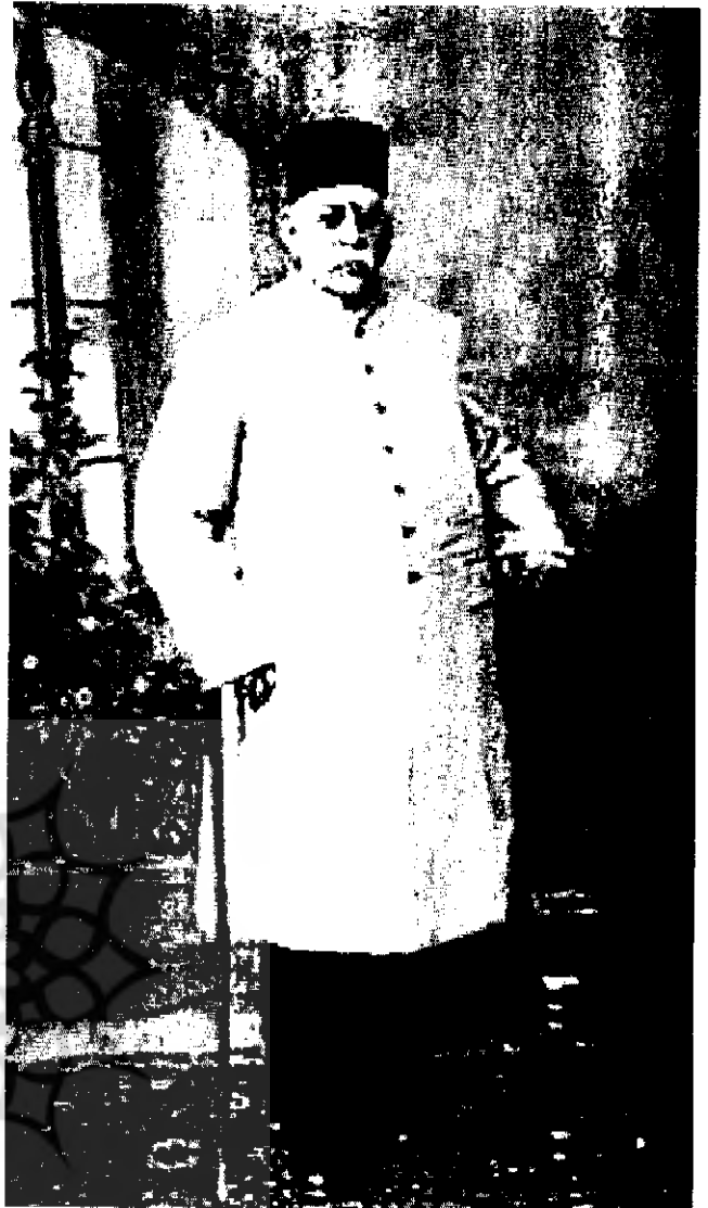
عبدالحسین میرزا فرمانفرما از نیکوکاران دوره قاجار

خیابان است. حدی شمالاً به اراضی ملکی خود حضرت والا فرمانفرما که از ورثه سید فنדרسکی خریداری فرموده و یک مقدار از آن به شرح فوق جزو محل پاستور شده؛ حدی شرقاً به اراضی ایتاعی از ورثه فنדרسکی؛ حدی غرباً به باغ اطلس ملکی خانم عزت الدوله که به دو صبیبه نظام الدین میرزا صلح کرده و به خندق شهر برای محل این مؤسسه تخصیص داد و در این مساحت بعضی از ابنیه لازمه مؤسسه مسطوره نباشد و مبلغ ده هزار تومان فوق الذکر را هم حضرت والا حسب القرار از مال خود دادند و به استحضار وزارت فواید عامه و به توسط مأمورین وزارت مزبوره به ضمیمه پانزده هزار تومان دولت به مصرف بنایی ابنیه آنجا رسید. پس از آن، حضرت والا فرمانفرمای معظم له در محضر مسعود شرح مطاع واجب الایتناع طهران، بالعمد و الرضاء والاختیار من دون شلیتة الاکراه و الاجبار، قریباً الی الله تعالی و طلباً لمرضاته،