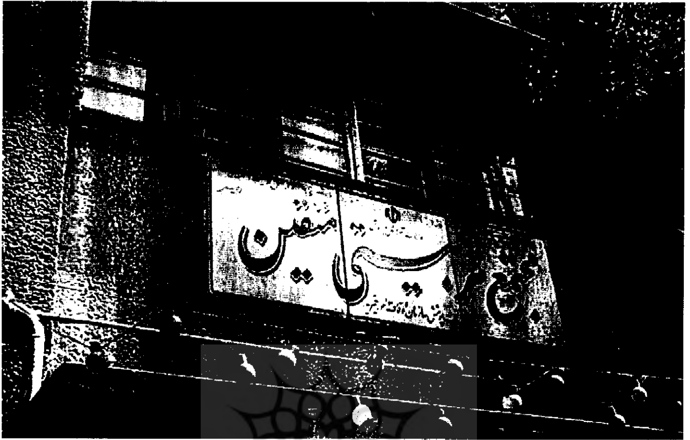
یتیم خانه عزیزخان خواجه (مجتمع تربیتی متقین کفونی در خیابان سرهنگ سخایی)

زنده کردن املاک خود اقدام کردند. اما پس از سالها آمد و شد و شکایت و درگیری، چون ماترک سهرابزاده جزو موارد پیچیده قضایی بود، و شخص رضاشاه عملاً املاک مذکور را وقف بنگاه خیریه و هنرستان کرده و یتیمخانه‌ای در محل همان دارالایتم عزیزخان ایجاد کرده بود، و نیز وقفنامه‌ای رسمی هم درین نبود، اداره املاک و اگذاری (۴۷) که عهده دار رسیدگی به این مراجعات و شکایت بود - قادر به حل و فصل منازعه موجود نگردید. سرانجام پس از چندین سال مکاتبات اداری بین مقامات عالی‌رتبه حتی نخست وزیر وقت، (۴۸) اداره یاد شده برای رفع اشکال و جلوگیری از ابطال وقف اموال بر هنرستان و بنگاه خیریه، پیشنهاد کرد که شاه وقت (محمدرضا پهلوی) طی یادداشتی املاک مذکور را رسماً وقف نماید تا بدین ترتیب هم و جاهت رضاشاه حفظ شده باشد، هم ورثه سهرابزاده - که دیگر با ملکی موقوفی طرف خواهند بود - از شکایت و پیگیری مطالباتشان صرف نظر نمایند.