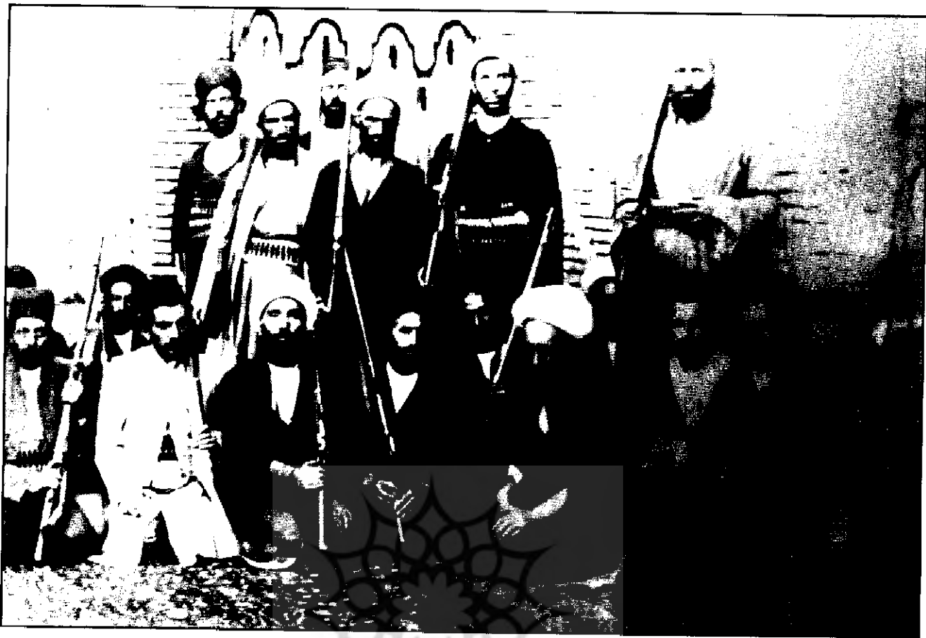
آیت الله شیخ محمدباقر بهاری در جمع مجاهدین مشروطه خود در دوران استبداد صغیر ۱۳۲۷ ق.

«وعلیکم السلام؛ اولاً انشاءالله تعالی موفق باشید و ثانیاً تلگرافی برای دربار مبارک به این مضمون فرستاده بودم. چند روزی گذشت اثری معلوم نشد و استفسار از حال آقایان هم ممکن نبود. از کثرت دلتنگی در کمال خفا به بهار رفته و در کمال سبکباری عازم قم گردیدم. غیر این طور، در نظر این روسیاه اسباب مهممه و اغتشاش بود و الحمدلله وله الشکر دیشب دو ساعت از شب گذشته به زیارت تلگراف ارکان اسلام - شیدالله ارکانهم - فائز گشته، بنای مراجعت شد. در اثنای راه، رقیمة سرکاری زیارت شد؛ ولی چون وقت حرکت در بهار وعده از ما خواسته بودند و اجابتش میسر نشد و مال و بعضی از لوازمات سفر هم در آنجا استفاده شده بود و لذلك امشب را بهار رفتم، صبح بعد از آفتاب انشاءالله رو به خانه خواهم آمد. دیشب دو صورت تلگراف و اعلانی نوشته نزد عمدة التجار حاجی شیخ تقی فرستادم. خوب است آنها هم به نظر شریف برسد. خداوند توفیق شکرانه این نعم عظمه را بر همه ماها کرامت فرموده، انا فانا رواج دین اسلام را بیش تر گرداند. میان راه به این چند کلمه جسارت شده و تفصیل موقوف بر مشافهه و ملاقات است؛ محمدباقر. (۶)»