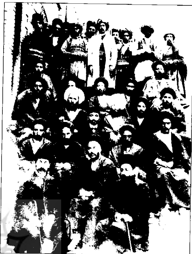
آیت الله حاج شیخ محمد باقر بهاری مجاهد مشروطه با تفنگ داران خود در سال ۱۳۲۸ ق.

کردند. (۴۳) این حرکت و قیام شیخ، با پذیرش اولتیماتوم روسیه توسط دولت ایران فروکش نمود و بحران موقتاً خاتمه یافت. آخرین دفاع شیخ محمدباقر از مشروطیت، در زمان شورش ابوالفتح میرزا سالارالدوله، پسر سوم مظفرالدین شاه برای تصاحب تاج و تخت به همراه محمدعلی شاه مخلوق در ۱۳۲۹ الی ۱۳۳۱ ق. بود. سالارالدوله، در این زمان غرب ایران را محل تاخت و تاز خود ساخته بود و شهرهای این منطقه را یکی پس از دیگری متصرف شد. (۴۴)