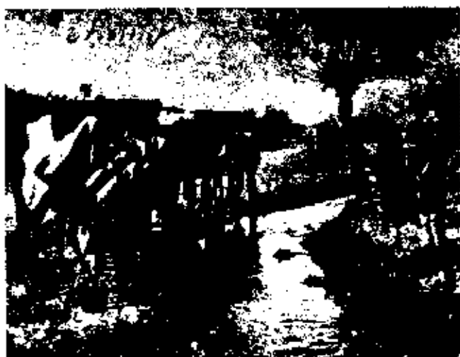
نهر جدا شده از رودخانه کرج شهر کرج