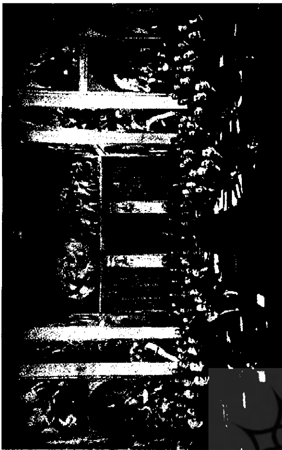
جلسه کنفرانس صلح لاهه در ۱۳۱۷ (۱۸۹۹)

انتخاب شده بود. در تاریخ ۲۹ فروردین ۱۳۰۵ طی نمره ۴۷۵ به اداره معارف اعلام شد که «چون میرزا محمدخان قزوینی به علت کسالت نمی‌تواند در کنگره مزبور حضور به هم رساند وزارت معارف یکی دیگر از نمایندگان دولت ایران در اروپا را جهت نمایندگی در کنگره مزبور معرفی نماید.» (۲۳)