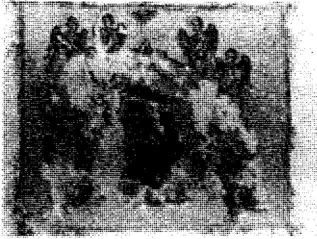
شکل ۴ - مینیاتور برجای مانده از روم شرقی (قرن پانزدهم) «آکاشینوس به مریمه پس از مرمت، با محلول ۳ درصد آب و الکل پولیمر ترکیبی وینیل استات و اتیلن»