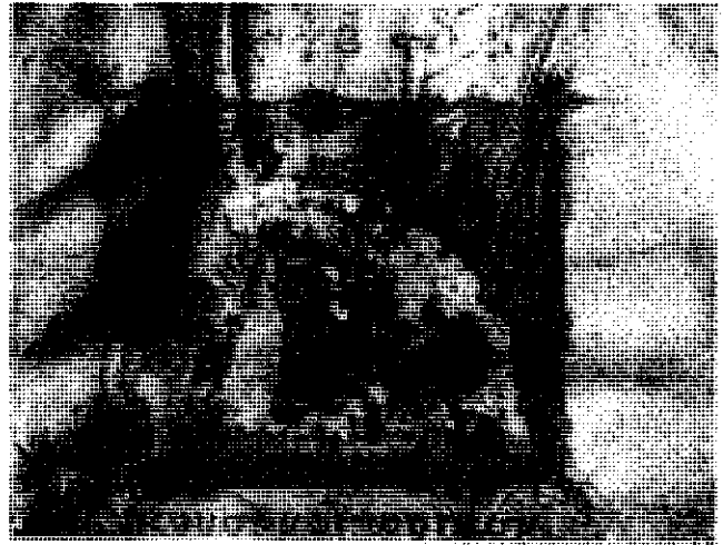
شکل ۳ - مینیاتوری از روم شرقی (قرن پانزدهم میلادی)، قبل از مرمت