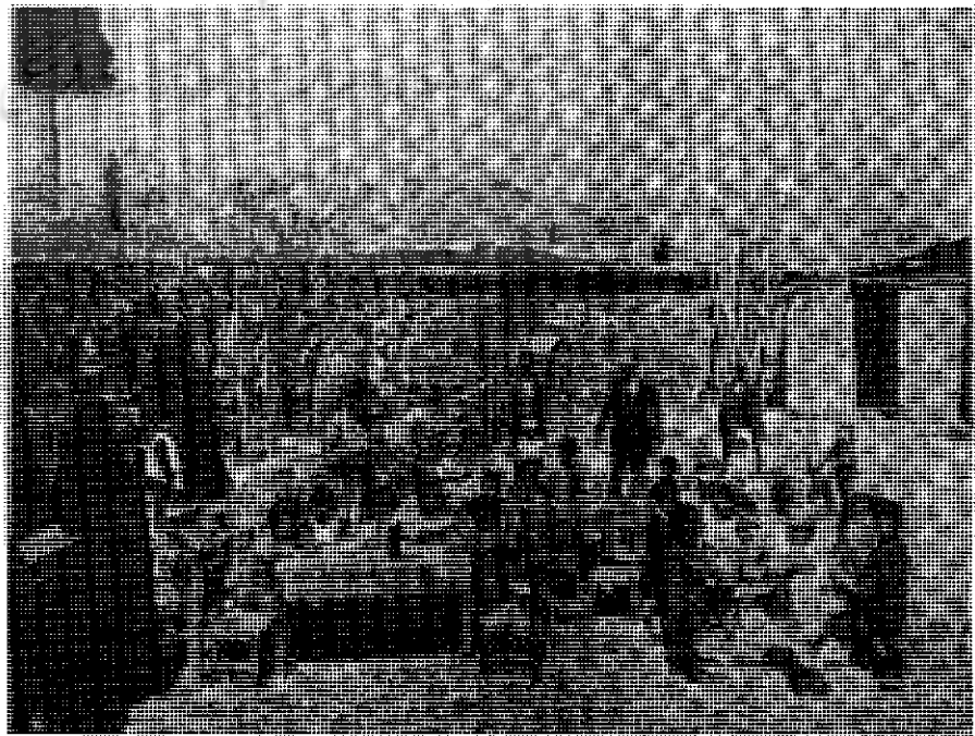
باغچه‌بان در کودستان شیراز ۱۳۰۷