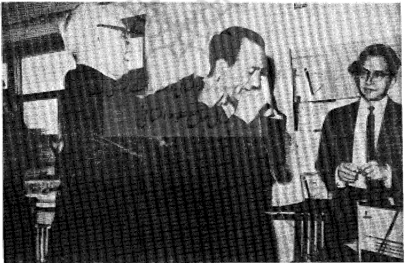
باغچه‌بان در حال نشان دادن طرز کار دستگاه اختراعی خود به یکی از استادان خارجی