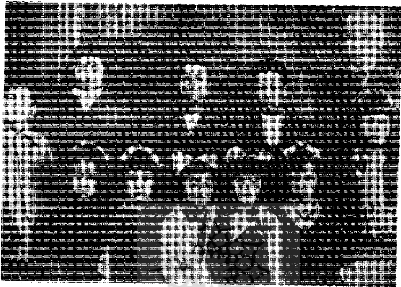
باغچه‌بان در کنار اولین دسته دانش‌آموزان خود در سال ۱۳۲۲ در تهران