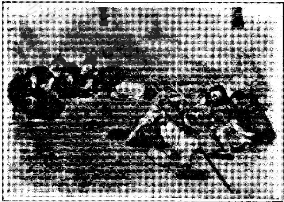
داخل شیره‌کش خانه

۲- کمیسیون درمان پس از چند جلسه بررسی درباره فرمول دارو و تهیه آن و طرز توزیع در سراسر کشور برنامه خود را تنظیم و به وزارت بهداشتی ارسال نمود ولی به هیچ‌وجه وسایل تهیه دارو فراهم نشد از ۴۱۵ میلیون ریال بودجه‌ای که از طرف وزارت دربار به وزارت بهداشتی جهت