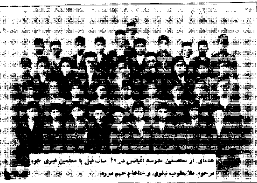
عده‌ای از معلمان مدرسه آلیانس در ۴۰ سال قبل با معلمان عبری خود در محرم بخارینتورب، بلژیک و استخدام حیم فرید

مدرسه بعداً به مدرسه آلیانس فرانسوی شهرت پیدا کرد و مدرسه دیگری نیز به نام مدرسه