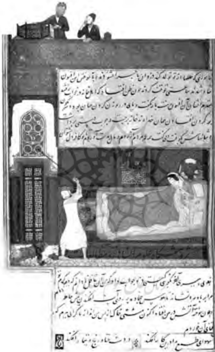
تصویر شماره ۴ - دزدی در اتاق خواب پیدا شده است؛ از کلیله و دمنه هرات دوره تیموری ۸۳۴ق.، ۱۳/۶×۱۰/۲ سانتیمتر.