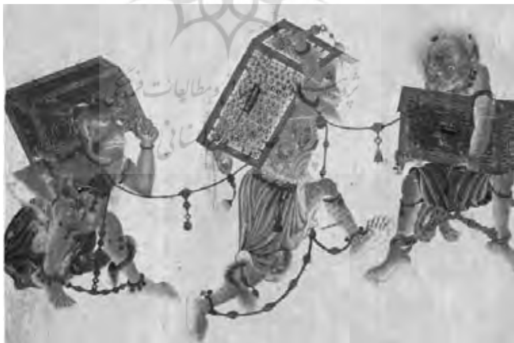
تصویر شماره ۱۰ - سه دیو زنجیر شده، صندوقهائی را حمل می‌کنند، گواش روی پارچه به صورت طوماری از همان آلبوم، صفحه b ۸۸، ۳۲/۵×۲۲/۴ سانتیمتر.