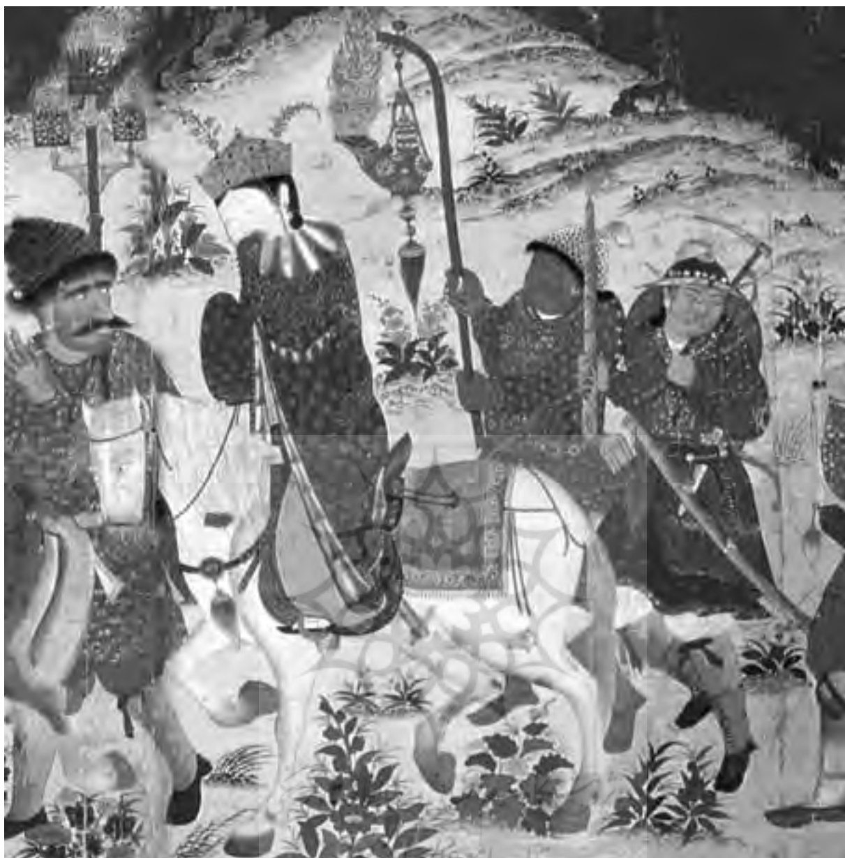
تصویر شماره ۸ - بخشی از نقاشی، جشن عروسی در حال حرکت دادن عروس، از آلبوم نقاشی صفحه ط ۳ و ۴a طومار، ۸۵/۹×۳۴/۵ سانتیمتر، تبریز آق قویونلو با کد H.2153 .