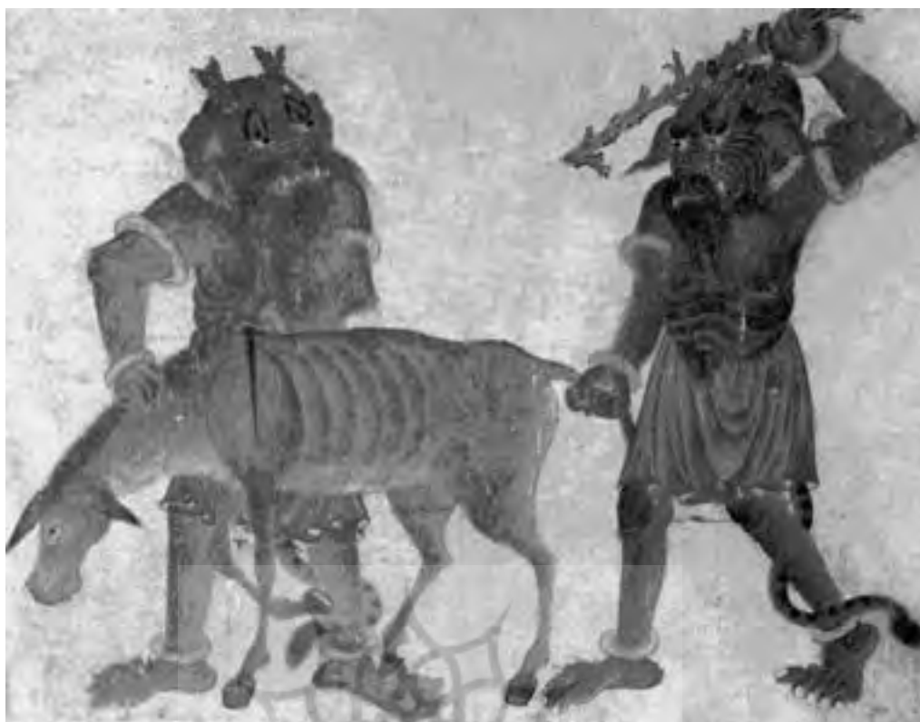
تصویر شماره ۹ - دو دیو، می‌خواهند سوار بر یک الاغ لاغر شوند، منسوب به محمد سیاه قلم؛ از صفحه ط ۲۷ آلبوم نقاشی دیوها، گواش و مرکب روی کاغذ تبریز آق‌قویونلو، ۳۵/۳×۲۶/۸ سانتیمتر با کد H.2153.