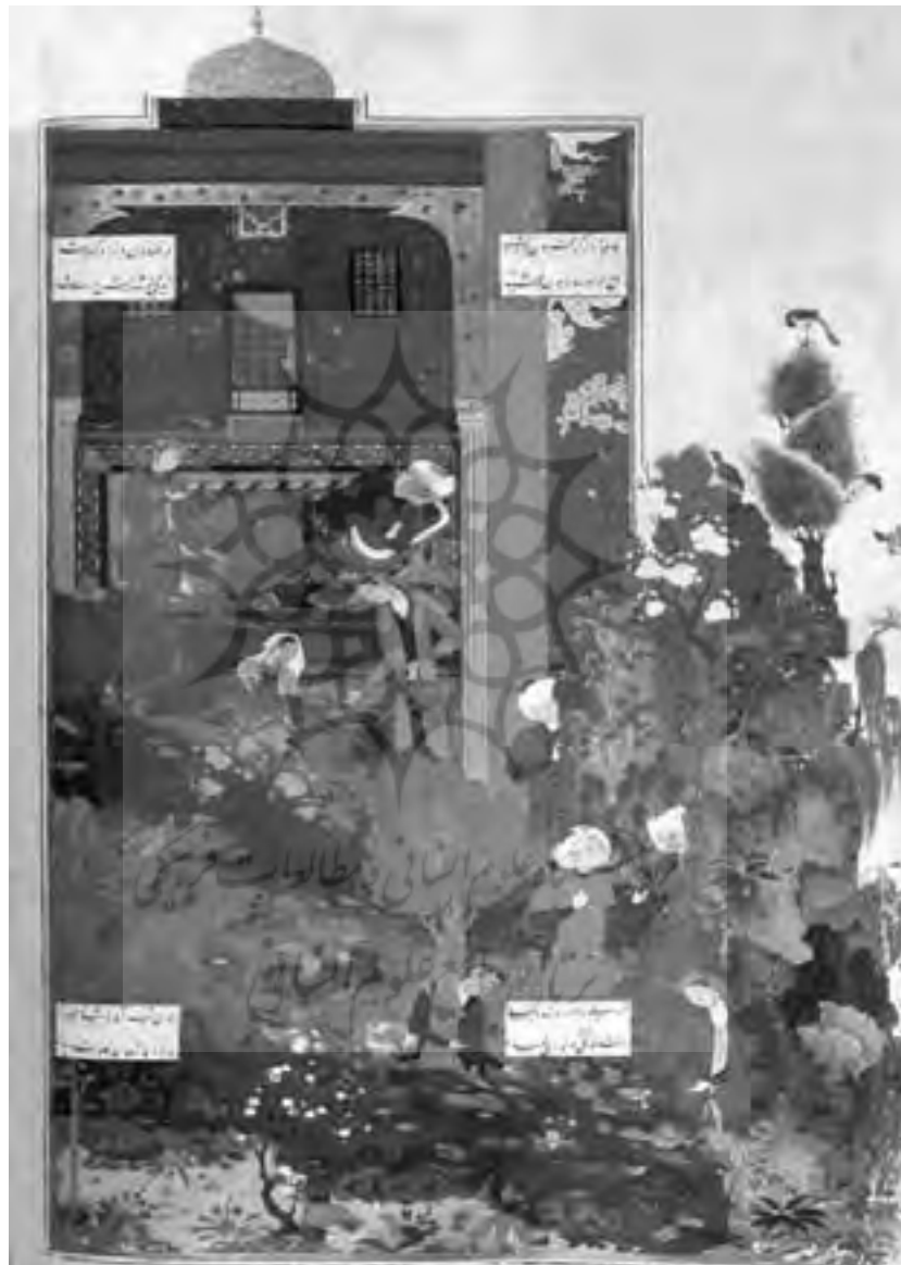
تصویر شماره ۷ - بهرام گور با شاهزاده موریس در قصر زرد، از خمسه نظامی معروف به خمسه یعقوب بیگ با کد H.762 .