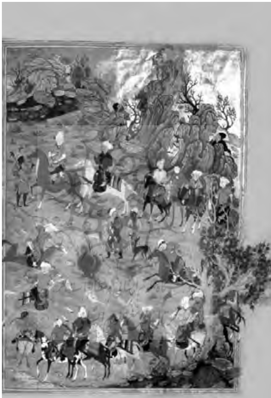
تصویر شماره ۵ - شکار سلطانی، از هشت بهشت امیر خسرو دهلوی ۹۰۲ق.، هرات دوره تیموری، مکتب بهزاد، از صفحه ۱، کل اثر ۲۰×۳۰ سانتیمتر با کد H.676.