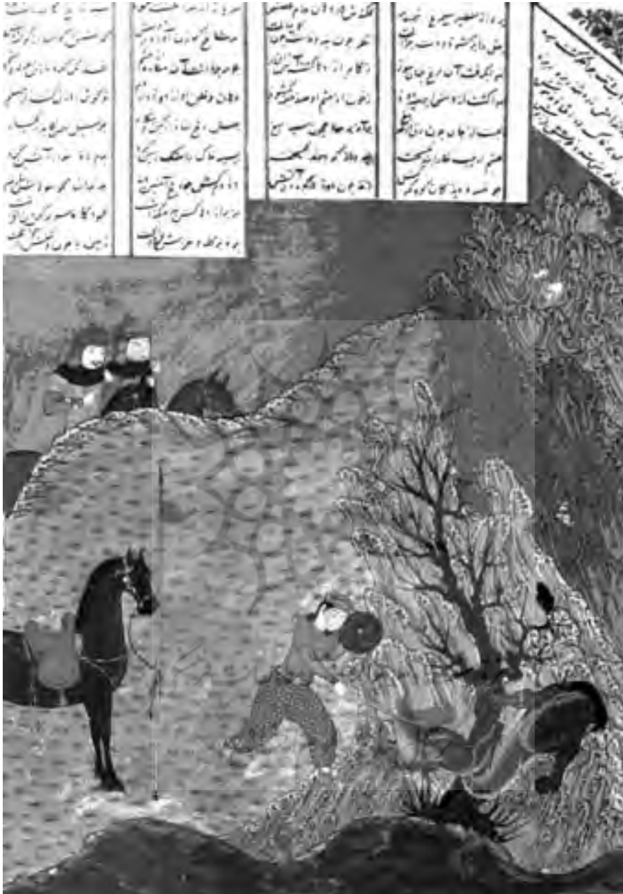
تصویر شماره ۲ - مبارزه نوروژ و اژدها، از یک داستان شاهنامه از دیوان شعر، صفحه ۱۳۶ b، ۱۶/۷×۱۲/۵ سانتیمتر.