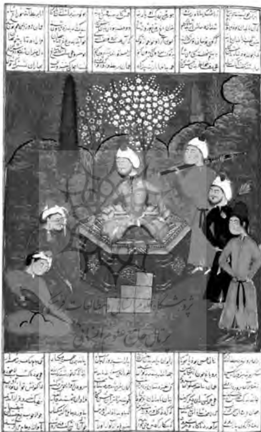
تصویر شماره ۱ - خسرو پرویز به بارید نوازنده گوش می‌دهد؛ از شاهنامه فردوسی مظفری شیراز، از صفحه a ۲۷۶، ۱۱×۱۳ سانتیمتر با کد H.1511.