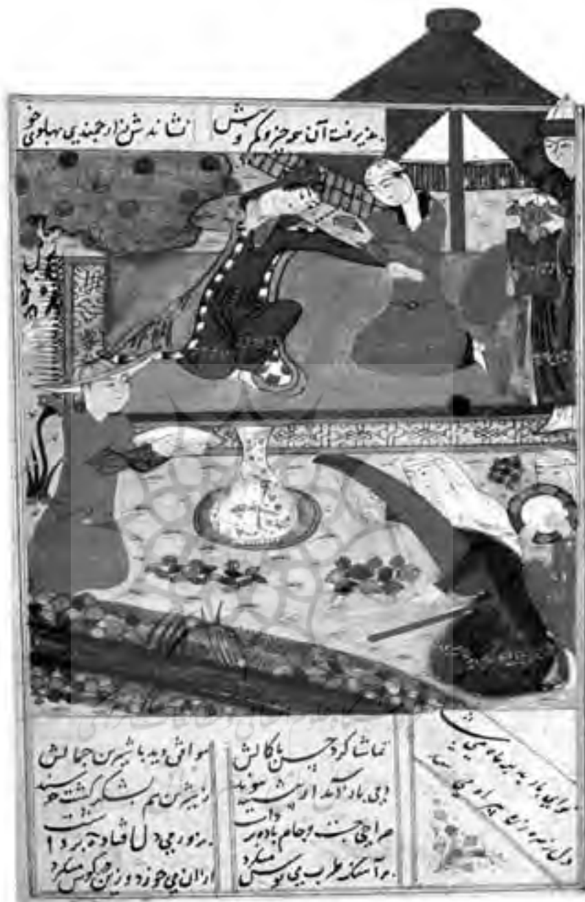
تصویر شماره ۳ - بر تخت نشستن خسرو پرویز و شیرین، از خمسه امیر خسرو دهلوی از شیراز تیموری ۸۵۰ق.، صفحه b ۱۲۳، ۸/۸x۱۱/۸ سانتیمتر با کد H.898 .