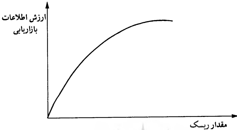
شکل شماره ۳- رابطه بین ارزش اطلاعات تحقیقات بازار و ریسک در تصمیم‌گیری‌ها