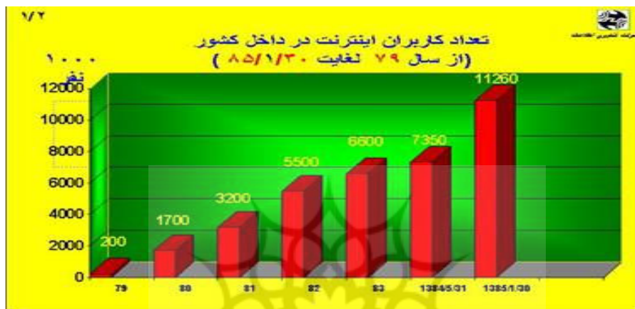
۲- نمودار رشد کاربران اینترنت در ایران از سال ۷۹ تا ۸۵

۲۰۰۶ حدود یک میلیارد و پنجاه میلیون نفر ذکر شد (Internet world statistics) و برای سال ۲۰۰۹ تعداد کاربران یک میلیارد و چهارصد میلیون نفر پیش بینی شده‌اند (Travel.com). آخرین آمار مربوط به جمهوری اسلامی ایران حاکی از آن است که تا پایان فروردین ماه ۱۳۸۵، تعداد کاربران اینترنت از مرز یازده میلیون نفر عبور کرده‌است (هفته‌نامه بزرگ‌تره فناوری).