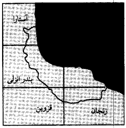
راهنمای نقشه‌های زمین شناسی ۱:۲۵۰,۰۰۰ --

برگ نقشه) به اکتشافات ناحیه‌ای نیاز دارد که این مهم توسط سازمان زمین شناسی در طول برنامه‌ی سوم توسعه صورت خواهد گرفت. ب) اکتشافات موضوعی با این که اکتشافات ناحیه‌ای استان گیلان چندان زیاد نیست، ولی طی برنامه‌ی اول (۱۳۶۸-۱۳۷۲)، سال ۱۳۷۳ و هم چنین