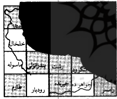
راهنمای نقشه‌های زمین شناسی ۱:۱۰۰,۰۰۰ --