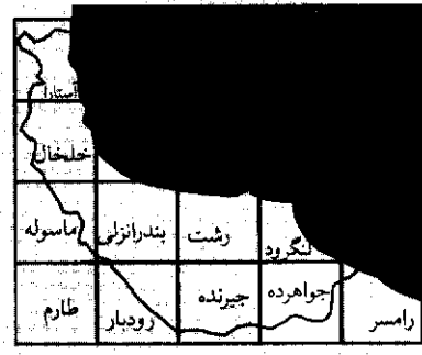
ورقه‌های ژئوشیمیایی بررسی شده --