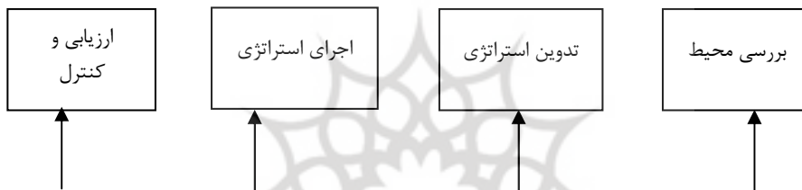
شکل ۲: عناصر اساسی فرآیند مدیریت استراتژیک

بررسی محیطی عبارت است از نظارت، ارزیابی و نشر اطلاعات مربوط به محیط‌های داخلی و خارجی یک مجموعه. محیط بیرونی ۳ یا خارجی شامل متغیرهایی (فرصت‌ها و تهدیدها) است که خارج از سازمان وجود دارند و از حیثه‌ی کنترل پیوسته‌ی مدیران خارج است این متغیرها فضا و بافتی را به وجود می‌آورند که سازمان یا مجموعه در آن وجود دارد و فعالیت می‌کند.