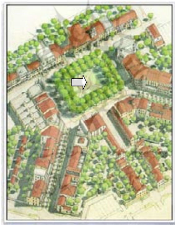
شکل ۱: رشد هوشمند، استفاده‌ی حداقل از زمین، استقرار منازل، مغازه‌ها به دور میدان عمومی، پارک‌ها، و فضاهای سبز. وجود درختان سبز، حس زیبای زندگی و فعالیت را تداعی می‌کند. مقیاس: شماتیک

رشد هوشمند با هدف ساختن جامعه‌ای با مفهوم یگانه‌ای از مکان و تأکید بر استفاده‌ی حداقل از اتومبیل، در واقع به دنبال درک محیطی بالا، تفسیر و ارتقای خوانایی محیط است.