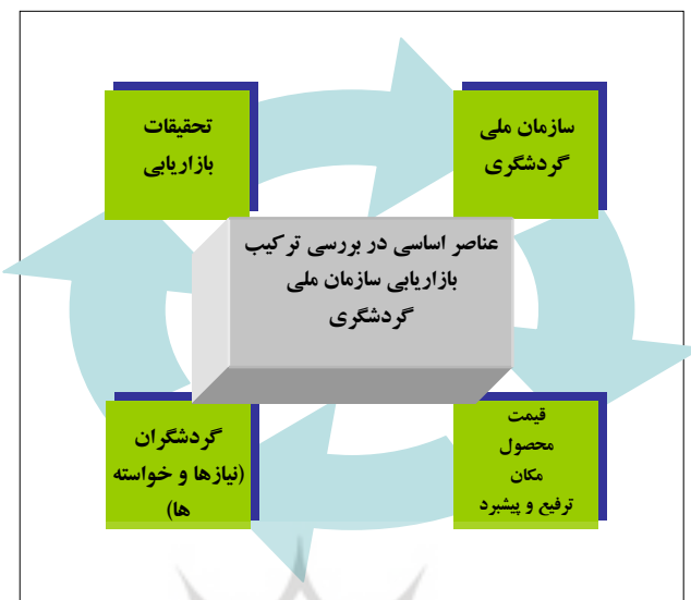
شکل ۲: عناصر اساسی در بررسی ترکیب بازاریابی سازمان ملی گردشگری مأخذ مطالب: (اسلام، ۱۳۸۲: ۲۷۵) تهیه شکل: پژوهشگران

مهمترین هدف بازاریابی گردشگری داخلی جلب هر چه بیشتر دیدارکنندگان از منطقه‌ای خاص است. به همین دلیل باید تصویر روشنی از امکانات، جاذبه‌ها و چگونگی دسترسی به آنها را فراهم آورد.