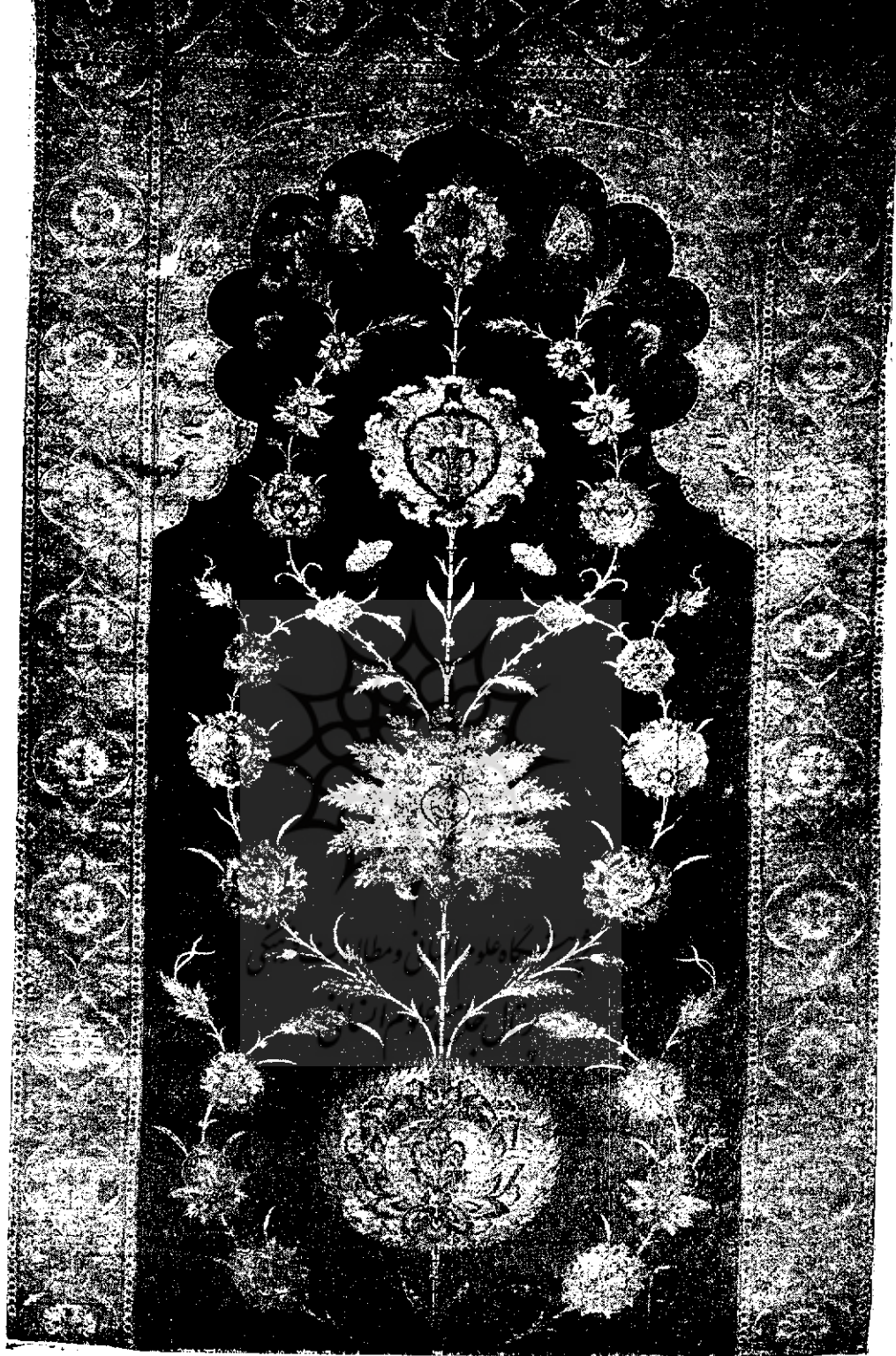
تصویر قالی ابریشمین کار ایران در قرن دهم هجری (درموزه ویکتوریا و آلبرت)