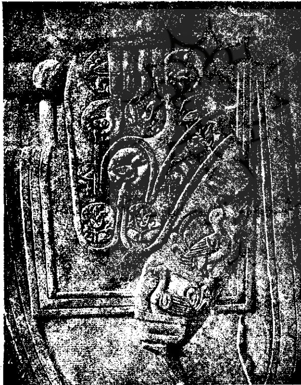
شکل ۲ - حجاری طاق بستان

در مجسمه سواره خسرو دوم پادشاه (۵۹۰ - ۶۲۹) شنل او یکی از آن نقش‌های مطلوب صنایع ساسانی را دارد و آن عبارتست از ازدهای طاوسی شکل که سرش سر حیوان گوشت خوار و پنجه‌های آن پنجه شیرست و در بوته حاشیه داریست که تقریباً عین آنرا در يك پارچه ابریشمی (گلهای سبز بر متن زرد) در موزه «ویکتوریا و آلبرت» ۱ در لندن می‌توان دید. روی دو نقش برجسته بزرگی که از شکارهای خسرو دوم (در حدود ۶۲۰)