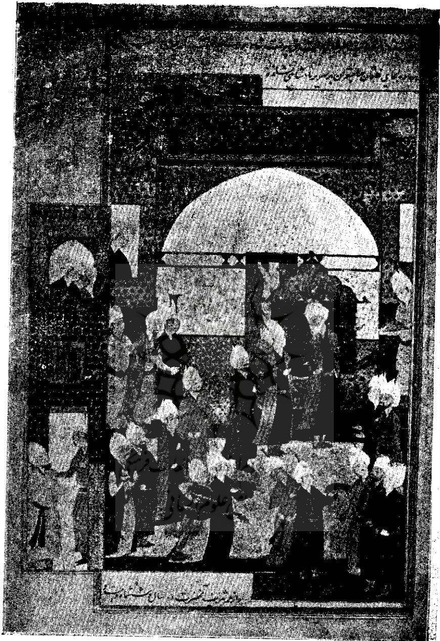
تصویر تاجگذاری شاه طهماسب اول