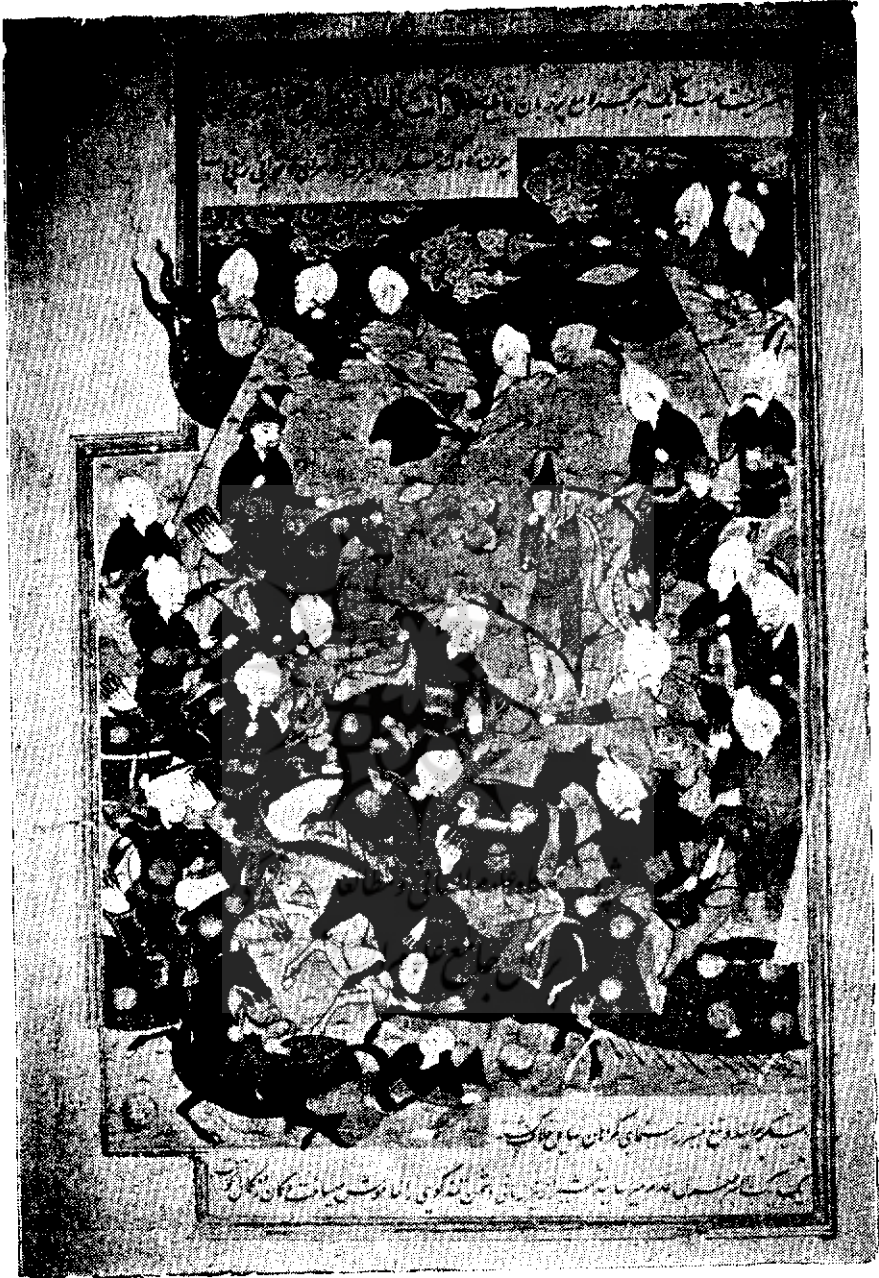
تصویر جنک شاه طهماسب با عیب‌داله خان از بک