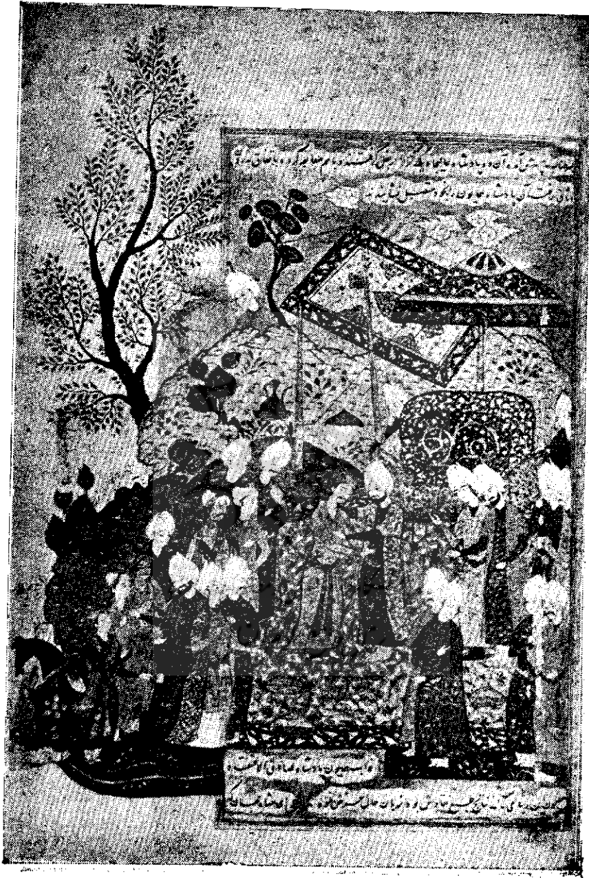
تصویر پذیرائی شاه ظهاسب از همایون شاه هندی