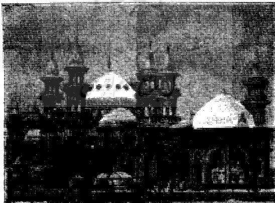
عمارت نمایشگاه نیزبی در سنه ۱۸۹۷ که بسبک ایران ( زمان صفویه ) ساخته شده است

مهمترین این ابنیه گور امیر است. معماری این بنا ساده و ظریف