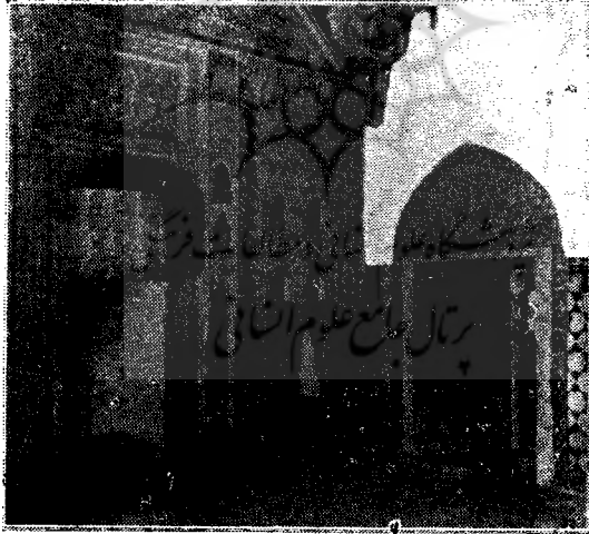
داخل عمارتی است در ترکیه که بسبک معماری زمان صفویه تذهیب شده.

فاطمیون دارد. بعضی از آنها مخصوص بوده است بقصر امرای آتقوم. اشکال لوحه‌ها عبارت است از غزالهائی که طرف‌حمله شیر واقع شده‌اند، و خرگوشهائی که زیر پنجه عقابها دست‌وپا میزنند، و یا دو مرغی که مقابل هم قرار گرفته‌اند و این تصاویر نقوش قماشهای ساسانی را با خاطر می‌آورد. چنین بنظر میرسد که بی‌مبالاتی در ترکیب تصویرهای روح دار با عقیده مذهبی خلفای فاطمی که شیعه بوده‌اند بی‌رابطه نبوده‌است، همین اشکال در روی پایه ظروف فلزی عهد فاطمی از قبیل گلدان، گلاب‌پاش، اساجه و عطرسوز مشاهده میشود. در این اشکال حیواناتی از قبیل شیر، غزال و اسب دیده میشود که شبیه بسبک صنعتی دوره اخیر ساسانیان است، چنانکه میتوان آنها را رابطه‌ای بین صنعت قدیم ایران و صنعت اسلامی قرن نهم میلادی بشمار آورد.