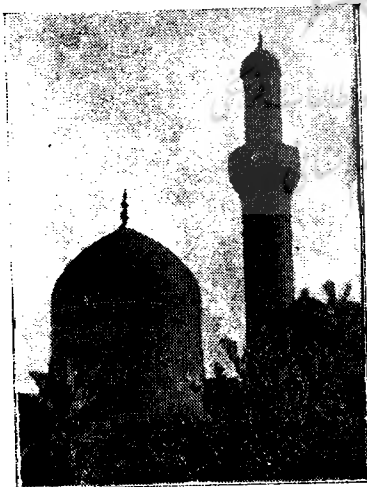
مقبره ابوحنیفه در بغداد

ایران که ایحظه‌ای ه طبع اعراب شده بود بزودی عقاید و منویات خود را به فاتحین تحمیل کرد و با ایشان در هیچ عهدی امتزاج نمود. خلفای عباسی از استخدام ایرانیان برای پیش بردن امور مختلفه خود نمی توانستند چشم پوشند. بهترین عناصر برای تشکیل سپاه، برای تزیین زندگانی پر شکوه آنها، برای حماسه سرائی فتوحات ایشان در میان ایرانیان یافت می شد، حتی مدتی مقدرات ممالک وسیعۀ اسلامی بدست بزمکیان که خانواده‌ای ایرانی بودند واگذار گردید.