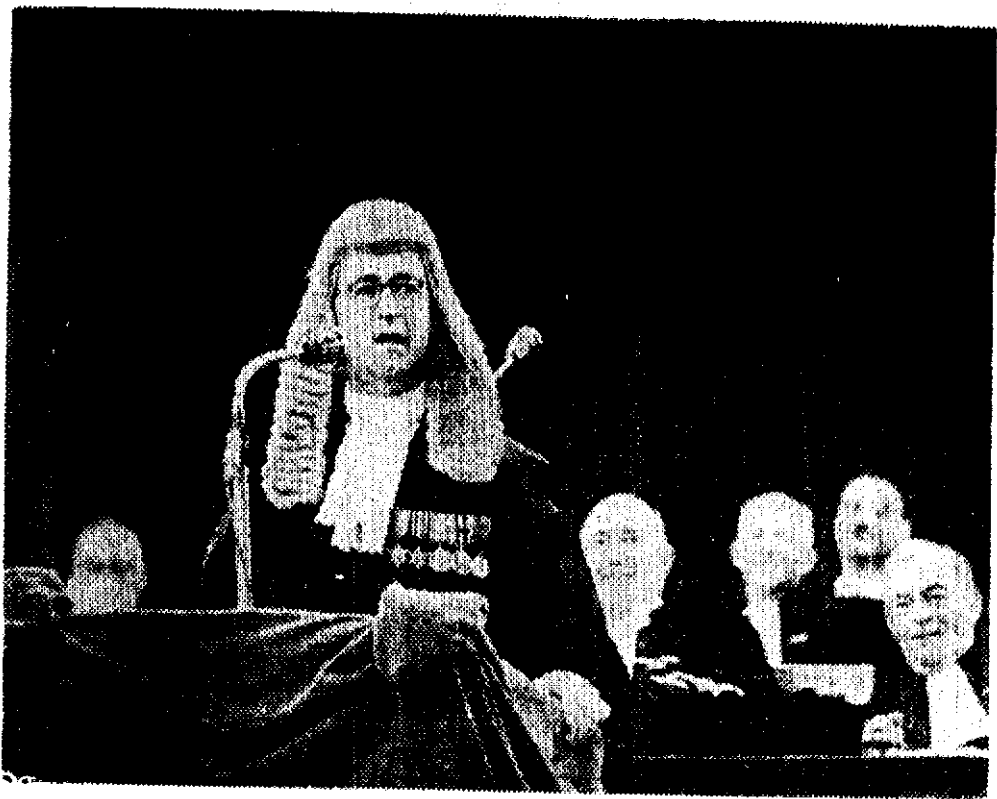
رئیس اتحادیه کانونهای انگلستان در حال سخنرانی در کنفرانس کارآموزی و کالای دادگستری پاریس

یکساعت ایراد نموده و سپس موضوع اصلی کنفرانس مطرح گردید . موضوع مورد بحث کنفرانس عبارت بود از «وکیل دادگستری قرن بیستم، مشاوره مؤسسات و مدافع حقوق بشر»