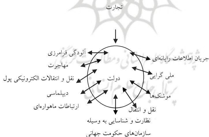
شکل ۱) دولت در عصر جهانی‌شدن (۳۳)

در عصر وابستگی متقابل ناشی از گسترش روند جهانی‌شدن، دولت‌ها به ندرت در انزوای کامل از یکدیگر به سر می‌برند. اکثر آنها در نظام‌های نسبتاً باثباتی شامل دولت‌های دیگری که بر رفتار آنها تأثیر می‌گذارند، قرار دارند. در نظام معاصر، دولت‌ها حق حاکمیت یکدیگر را به رسمیت می‌شناسند و بنابراین، «طرح» دولت‌محور متضمن تلاشی برای بازتولید هویت خود آنها و همچنین نظامی است که آنها بخش‌های آن را تشکیل می‌دهند: یعنی جمع دولت‌ها (۳۱) پیدایش اقتصاد جهانی پیچیده، اثراتی به مراتب فراتر از تجارت بین‌المللی کالاها و خدمات داشته است. اکثر شرکت‌ها یا کارکنان، در تمامی قلمروهای جداگانه فعالیت، برای تسهیل ارتباطات، هماهنگ‌کردن استاندارد و سازگارشدن با تغییرات پیچیده، سازمان‌هایی تشکیل داده‌اند. (۳۲)