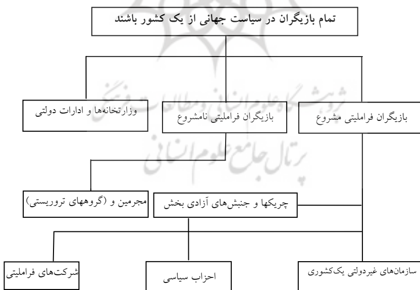
شکل ۳) تقسیم‌بندی بازیگران سیاسی جهان (۶۱)

در نهایت، این را هم می‌بایست در روابط بین دولت و کنش‌گران غیردولتی مد نظر قرار داد که برخی تنش‌های داخلی و انقلابات، رد پای مناقشه بین کنش‌گران غیردولتی داخلی با دولت را نمایان می‌سازد که این امر به پتانسیل درونی نهادهای غیردولتی در شکل‌دهی به کنش‌های منتج به تغییر در وضعیت سیاسی اشاره دارد. (۶۰)