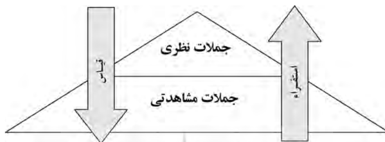
شکل (۱): مدل تحویل‌گرایانه ساختار معرفت علمی

و گزاره‌های علمی را به دو دسته کلی تقسیم‌بندی می‌کنند: گزاره‌های نظری ۱ و گزاره‌های مشاهده‌تی. ۲ یک عقیده‌ی کلاسیک در حوزه‌ی فلسفه علم که آن را می‌توان تحویل‌گرایی ۳ نام نهاد، نوعی ارتباط سلسله‌مراتبی را میان این دو دسته از گزاره‌های علمی مفروض می‌دارد.