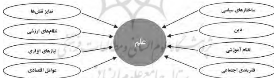
شکل (۲): مدل سازمان بخش برنارد باربر

در حوزه مطالعات درونی در جامعه‌شناسی علم رویکردها، دیدگاه‌ها و جریانهای فکری متعدد و متنوعی را می‌توان شناسایی کرد. مرتون (۱۹۷۳) پس از اینکه از علایق اولیه خود در زمینه نگاه بیرونی به سمت رویکردهای درونی تمایل پیدا کرد، بر مطالعه ارزش‌ها و هنجارهای ۲ علم متمرکز شد و مجموعه‌ای از ارزش‌های فرهنگی علم را شناسایی و فرمول‌بندی کرد. این ارزش‌های فرهنگی به عقیده مرتون ساختارها و هنجارهایی جامعه‌شناختی را برای جامعه علمی به ارمغان می‌آورند و نوعی مکانیزم کنترلی را بر این جامعه اعمال می‌کنند که موجب تقویت هنجارهای معرفت‌شناختی ناظر بر روش‌های فعالیت علمی می‌گردند.