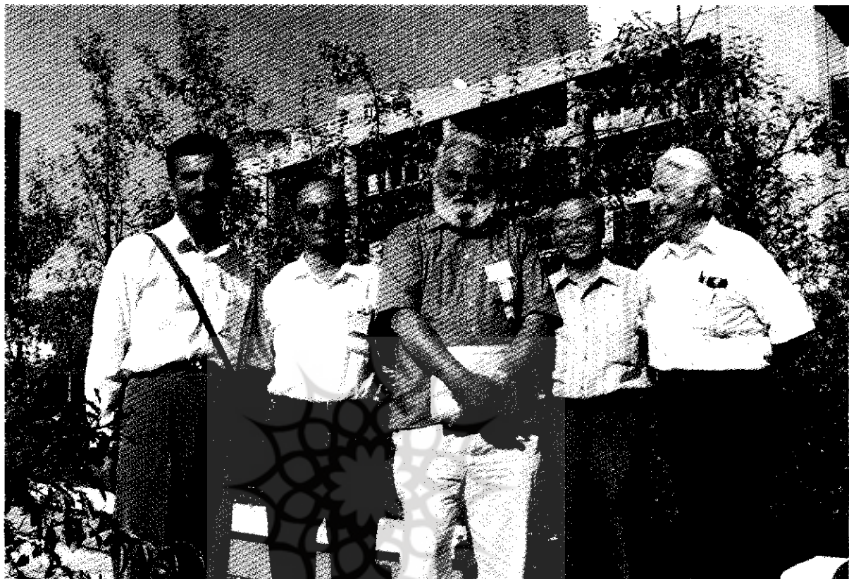
تصویر تعدادی از شرکت کنندگان در کنفرانس . از راست به چپ :