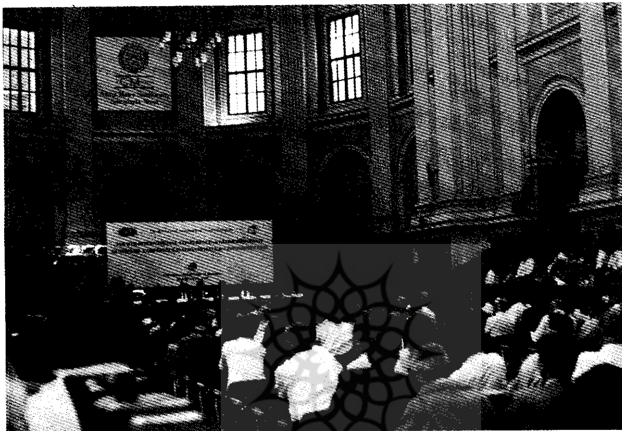
مراسم افتتاحیه کنفرانس در محل کلیسای تاریخی سنت لوجیای شهر بولونیا در ایتالیا

-Ahmadi, h. Etude de la Geomorphologie et du systeme de l'erosion dans le Bassin -Versant de Taleghan (Affleurements du Bassin Versant du sefid-rud- Ouest d, Alborz).