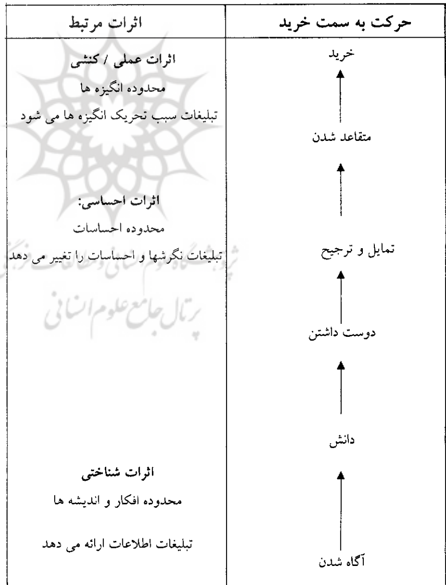
شکل ۱ - گامهای مختلف در مدل تاثیر ارتباطات

فروش انتقاد دارند، عقیده دارند که نقش اول ارتباطات منسجم بازاریابی، ارتباط برقرار کردن با مخاطبان هدف است و برنامه ریزی برای اهداف تبلیغات باید بر مبنای اهداف ارتباطات باشد زیرا انتظار نمی رود که مشتریان سریعاً به تبلیغات عکس العمل نشان دهند. در واقع تبلیغات باید اطلاعات مرتبط را به مخاطبان منتقل کند و تمایل مثبتی در آنها نسبت به نام تجاری محصولات شرکت قبل از اینکه رفتار خرید اتفاق بیفتد ایجاد کند. تبلیغات و سایر تلاشهای ترفیعی به منظور دستیابی به اهداف ارتباطی از قبیل افزایش دانش مخاطبان نسبت