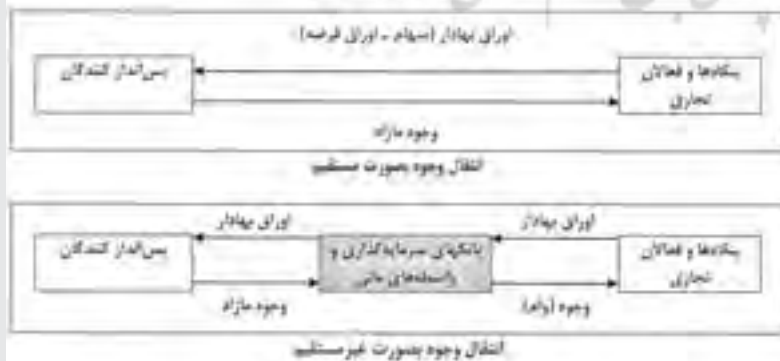
فراگرد شکل‌گیری سرمایه

در فرآیند انتقال مستقیم وجوه و اوراق بهادار، سهام یا اوراق قرضه یک مؤسسه (بنگاه تجاری و یا واحد تولیدی)