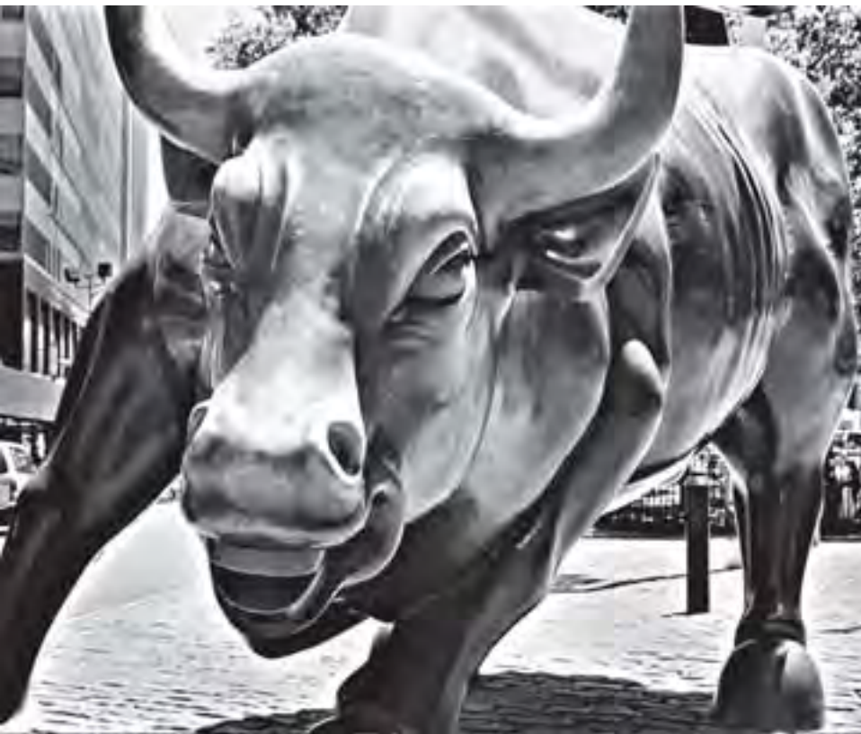
نماد بازار سرمایه امریکا.

برای کسب پیشنهادهای مطلوب از سوی عرضه‌کننده‌ها با هم رقابت می‌کنند. در شرایط رقابتی، هر یک از طرفین، به صورت اختیاری و با توجه به منافع شخصی با طرف مقابل به تعامل می‌پردازد. ۷