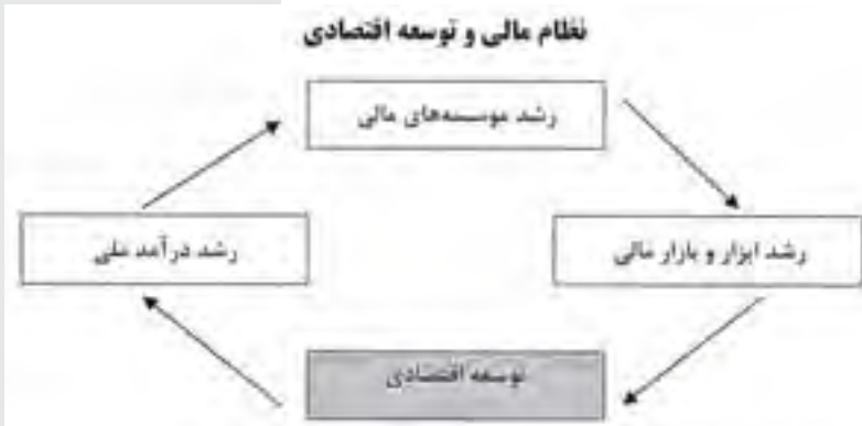
نمودار شماره دو

را متأثر می‌سازند. از اینرو، به کارگیری این نوآوری‌ها مستلزم تأمین سرمایه لازم می‌باشد و نهادهای مالی می‌توانند این عمل را به شکل مطلوب انجام دهند. بدین ترتیب، نظام مالی می‌تواند از طریق وارد نمودن اینگونه نوآوری‌ها در فرآیندهای تولیدی، بر رشد اقتصادی اثر گذارد ۲۳ (نمودار شماره دو).