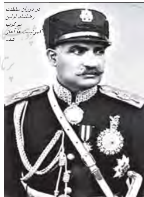
در دوران سلطنت رضاشاه، اولین سرکوب کمونیست‌ها آغاز شد...

بدیهی است که این اقدامات و به خصوص اخراج ارتش ملی ایران از آذربایجان، باعث نگرانی میهن دوستان گردید و به اصطلاح زنگ‌های خطر به صدا درآمدند. کابینه مرحوم حکیمی نیز به علت کوتاهی در انجام وظایف خود سقوط کرد و قوام السلطنه به نخست‌وزیری رسید. برنامه اصلی دولت قوام بیرون راندن ارتش سرخ از ایران بود، زیرا فرقه دموکرات را زایده‌ای از آن می‌دانست، لذا راه حل این مشکل بزرگ را مذاکره مستقیم دانست.