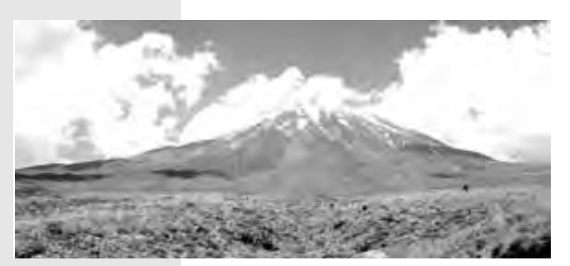
نمایی از کوه آرارات،الهامبخش بنیانگذاران بانک آرارات.

Ararat Bank ارمنستان بانک توسعه و بازسازی اروپا<sup>(۱)</sup>(EBRD) یک خط اعتباری پنج میلیون دلاری را به اجرای برنامه تسهیل تجارت خود در ارمنستان اختصاص داده و قصد دارد تا این سرمایه قابل توجه را در یک بانک خصوصی ارمنستانی به نام بانک آرارات، سرمایه گذاری کند. قرار است یک تیم