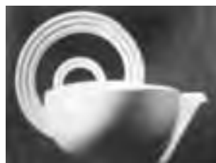
تصویر ۲- قوری سرامیکی، ۱۹۸۷.