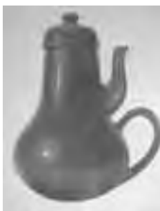
تصویر ۳- قوری مازوخیستی.

نمودار معنی شناسی محصول توسط کلاوس کریپندورف ۱ در سال ۱۹۸۹ ارائه شده است، این یک مدل اصلاح شده از تئوری ارتباط در طراحی محصولات است. تاکید این مدل بر تاثیر زمینه در چگونگی معنی یک محصول می باشد. طراح (فرستنده) پیام محصول را خلق می کند و کاربر (دریافت کننده) بر روی آن چیزی که دریافت کرده عمل می کند. طراح یک مصنوع می آفریند که منظور طراح را به صورت فرم مجسم می کند. کاربر آن محصول را به کار می بندد و سعی می کند که از شکل آن احساس بسازد. بنابراین سعی می کند تا مفهوم و معنایی را استخراج کند (نمودار ۳). به این ترتیب طبق نظر کریپندورف معنا شناسی محصول در نهایت عبارت است از مطالعه و بررسی ارتباط موجود میان فرمی که طراح خلق کرده و معنایی که کاربر خلق می کند (Krippendorff, 1997).