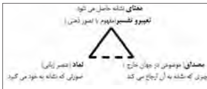
نمودار ۱- مثلث دلالت (مثلث معنایی). (ماخذ: صفوی، ۱۳۸۳، ۵۶)

هم معنی هستند. همچنین برابری فرم و محتوا با صورت و معنی می تواند اشاره دوباره ای باشد به برابری عملکرد هر شیء با معنی آن. به عبارت دیگر می توان گفت: معنی یک شیء و محصول صنعتی همان عملکرد آن محصول می باشد (نمودار ۲). پس طبقه بندی اشیاء برای شناسایی آنها می تواند به دو علت باشد: ۱) شباهت اشیاء در فرم و شباهت اشیاء در عملکرد؛ ۲) تفاوت اشیاء در فرم و تفاوت اشیاء در عملکرد.