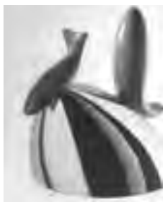
تصویر ۶- کتری، اثر فرانک جری، ۱۹۹۲. ماخذ: (Riley, 498)