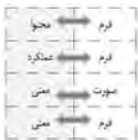
نمودار ۲- رابطه فرم و معنی و عملکرد. (ماخذ: نگارنده)