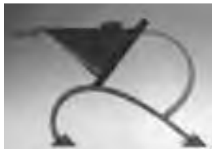
تصویر ۴- قوری، اثر مانتو تان، ۱۹۸۳.