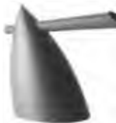
تصویر ۵- کتری، اثر فیلیپ استارک، ۱۹۸۹. ماخذ: (Riley, 498)

همیشه بدنه، دسته و لوله عنصر ثابت و اصلی قوری و کتری بوده اند؛ اما امروزه جای به روش دیگری تهیه می شود، با استفاده از چای کیسه‌ای دیگر نیازی به قوری نیست، می توان به صورت فوری و در یک لیوان آب جوش چای تهیه کرد. اختراع و معرفی یک سیستم جدید برقی برای جوشاندن فوری آب، باعث ظهور بسیاری از محصولات جدید با کاربرد متفاوت (چای ساز یا قهوه ساز) به بازار شد. نکته مورد نظر در اینجاست که در آخرین مدل ظروف چای ساز کلیه نشانه‌های مربوط به ظروف قدیمی و معمولی کاملاً حذف شده و دیگر دسته و لوله ای دیده نمی‌شود؛ و در اولین ارتباط دستگاه چای ساز شبیه قهوه ساز یا دستگاه آب میوه گیری و امثال آن به نظر می رسد. در این حالت نیاز به علائم گرافیکی کوچکی است که در کنار دگمه‌ها و پیچ تنظیم دستگاه قرار بگیرد تا راهنمایی برای کاربر دستگاه باشد.