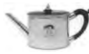
تصویر ۱- قوری مدالیون، ۱۷۷۸.