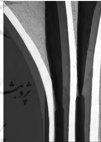
تصویر ۲- عکس انتزاعی، یزد - باغ دولت آباد (۱۳۸۶).

عکاسی انتزاعی ۲۷ اصطلاحی است عام، برای شیوه‌های افراطی هنر سده‌ی بیستم در برابر سنت طبیعت‌گرایی. اما در تعیین و تعریف حدود عکاسی انتزاعی اختلاف نظر وجود دارد. سادگی یا به بیان دقیق‌تر خلاصه کردن و حذف زواید، علامت مشخصه‌ی عکس‌های انتزاعی است در این بینش هنرمند ابتدا مشاهده می‌کند و سپس آنچه را که لازم است برمی‌گزیند. در عکاسی انتزاعی برخلاف عکاسی واقع‌گرا دیگر بازنمایی عین واقعیت بیرونی به طور کامل ملاک عمل قرار نمی‌گیرد. عکس‌های انتزاعی دارای پیچیدگی‌هایی می‌باشند که مخاطب برای درک آنها باید دانش هنری و بینش عمیقی داشته باشد. در غیر این صورت قادر به برقراری ارتباط با آنها نخواهد بود (تصویر ۲).