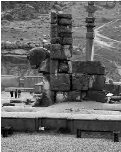
تصویر ۱- عکس واقع‌گرایانه، شیراز، تخت جمشید (۱۳۸۶).

واقع‌گرایی یکی از قدیمی‌ترین نظریه‌های هنر است. "جان سارکوفسکی" ۱۷ نویسنده و عکاس معاصر (۱۹۲۵-۲۰۰۷) اظهار می‌کند که بنابر پیش‌فرض بنیادین واقع‌گرایی، از دید شخص واقع‌گرا، از آنجایی که جهان معیار حقیقت است جمالی بی‌بدیل دارد و شریف‌ترین هدف هنرمند این است که بکوشد عالم را با تمام تنوعش، درست و دقیق تصویر و توصیف نماید (Szkowski, 1978, 9).