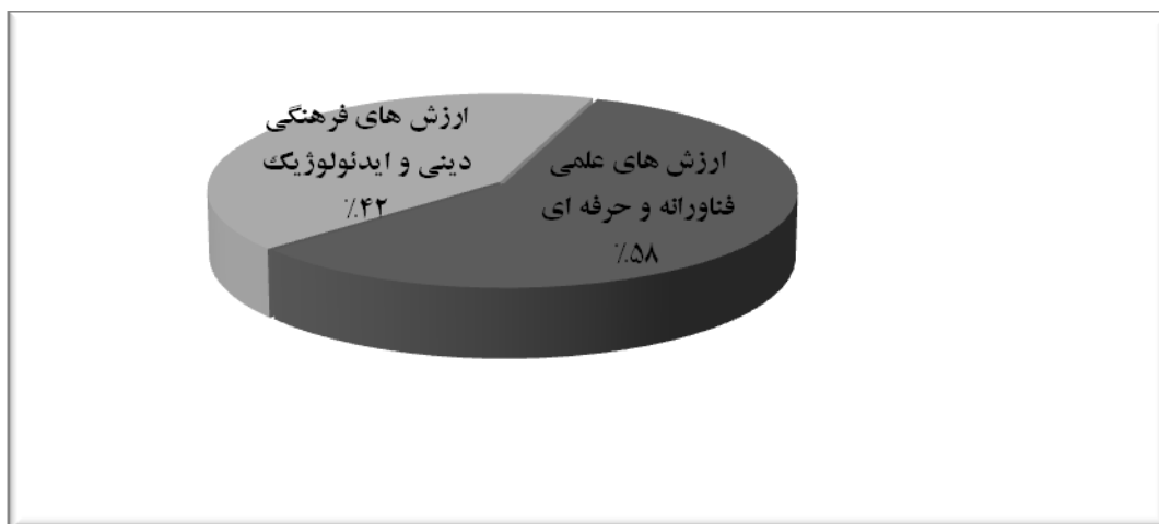
شکل ۱) ارزش‌ها و رویکردهای کلی حاکم بر نقشه

نخست مضامین فرهنگی، دینی و ایدئولوژیک که تعداد آن ۱۵ مورد است و گروه دوم سایر مضامین که عمدتاً به ارزش‌های علمی و فناورانه و حرفه‌ای بر می‌گردد و تعداد آن ۲۱ مورد است. در نمودار زیر ترکیب و فراوانی این ارزش‌ها ملاحظه می‌شود.