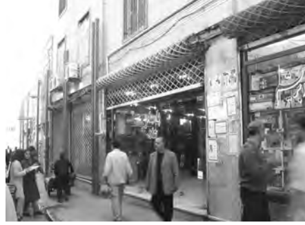
تصویر ۱۰- ورودی پاساژ مروی قبل از مرمت.