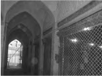
تصویر ۱۱- ورودی پاساژ مروی بعد از مرمت.