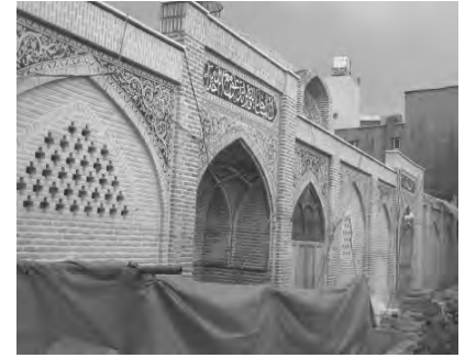
تصویر ۹- آب انبار مسجد حکیم بعد از آوردن از زیر خاک.