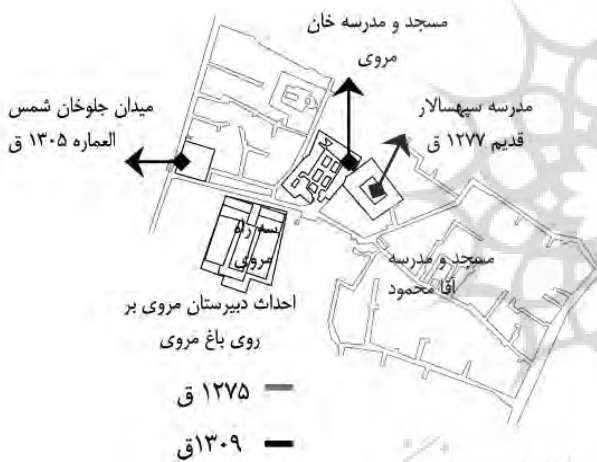
نقشه ۱ - مطابقت نقشه ۱۲۷۵ ق با ۱۳۰۹ ق.