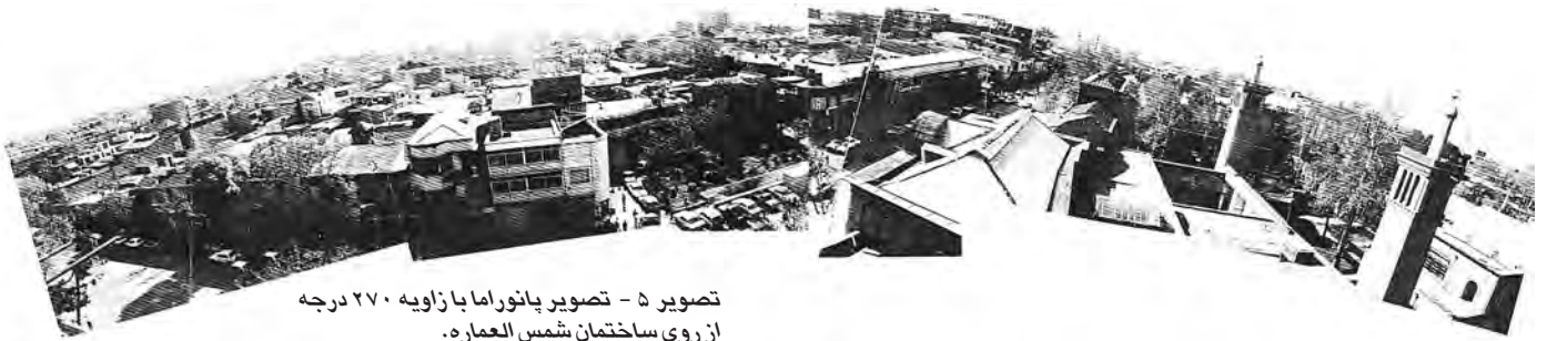
تصویر ۵ - تصویر پانوراما با زاویه ۲۷۰ درجه از روی ساختمان شمس العماره.

وضعیت همجواری کاخ بادگیر ( سمت چپ ) سردر شمس العماره، خیابان ناصرخسرو، مناره ها و کنبند مسجد امام ( شاه سابق ) و میدان جلوخان شمس العماره به همراه سیمای عمومی این موقعیت از عرصه شهری تهران امروز. ماخذ: (مختاری، ۱۳۵۹، ۱۲)