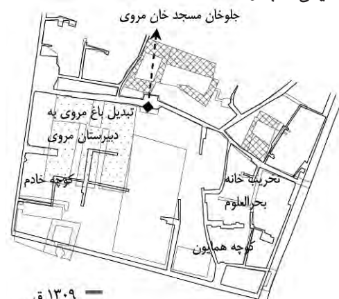
نقشه ۲ - مطابقت نقشه های ۱۳۰۹ ق و ۱۳۷۴ ش.