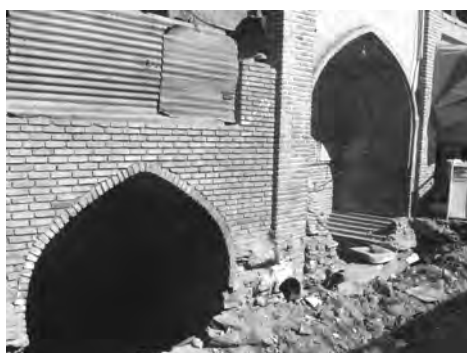
تصویر ۸- آب انبار مسجد حکیم در حال در آوردن از زیر خاک.

برای ترفیع مشکلات بافت گذر مروی باید محله را هم به لحاظ کالبدی و هم به لحاظ عملکردی مرمت و احیاء نمود و گرنه مرمت و احیاء تک بناها نمی تواند راهگشا واقع شود. خوشبختانه قطعات مخروبه و متروکه آن اغلب به صورت ملکی می باشند که این امر