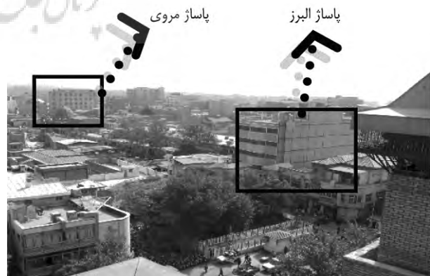
تصویر ۴ - میدان مروی از بالای عمارت شمس العماره، این تصویر بیانگر تغییرات ایجاد شده در سیمای میدان و ساخت پاساژ جدید در ابتدای بازارچه مروی نسبت به تصویر بالا که مربوط به سال ۱۳۵۹ ش می باشد، است.