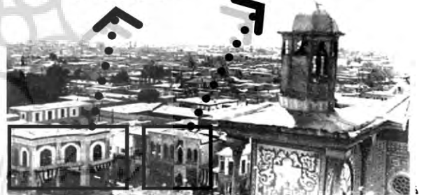
تصویر ۳ - میدان مروی.

در نمای این بنا امروزه آثاری از مشخص های سیمای این بنا امروزه از حالت قاجاری درآمده و به شیوه معماری دوره پهلوی آن، مرمت گردیده است.