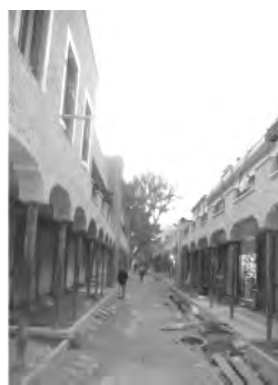
تصویر ۷- گذر مروی بعد از مرمت.