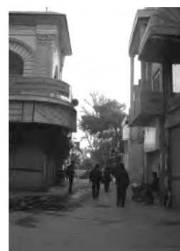
تصویر ۶- گذر مروی قبل از مرمت.